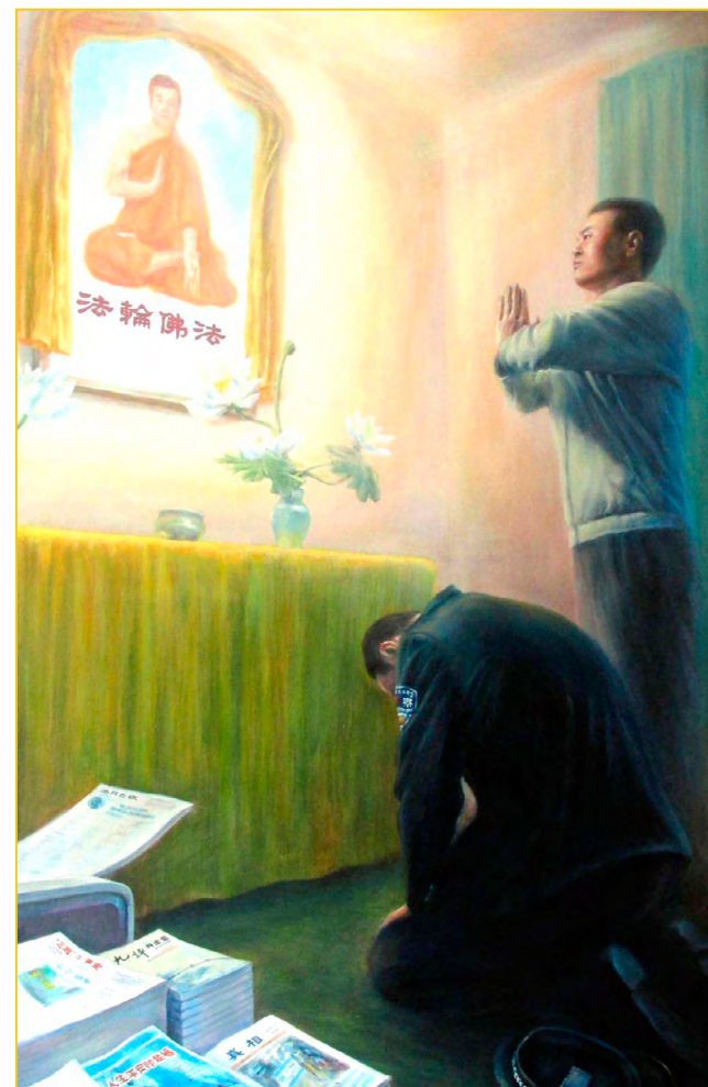
作者：中国西北地区法轮功学员 归真