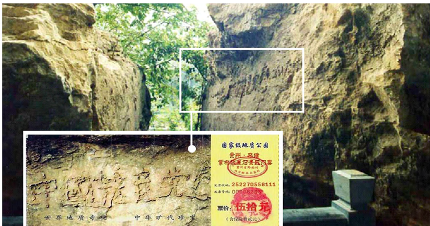
▲上图为“藏字石”照片，小图为风景区门票。

几千年来的中国，在要出大事之前，就一定有奇事发生，上天或以瑞兆示吉，或以凶相警世。今天，“藏字石”呈现“中國共產党亡”，正是上天对中共的大审判：天真要灭中共了。