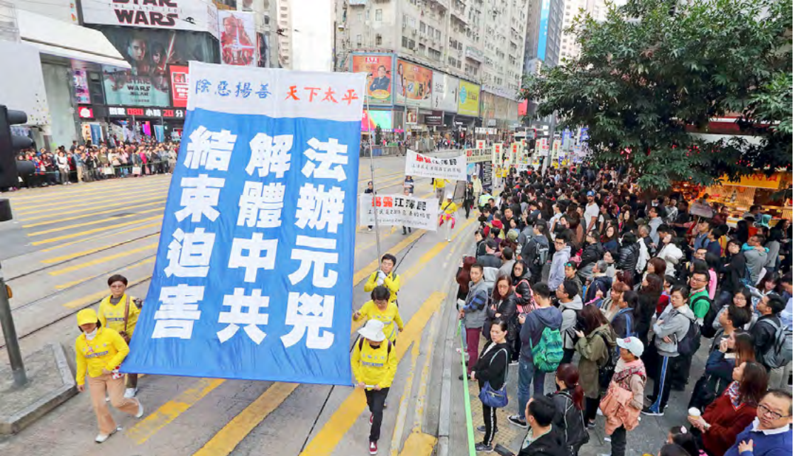
图：2017 年 12 月 10 日香港法轮功学员举行反迫害集会游行。

迫害你；你讨公道时，它说你反政府……总之，你跟它不一致了，它就说你“搞政治”。“搞政治”只是中共为了迫害人民而强加的一顶大帽子而已。