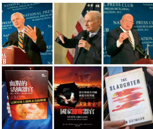
上图：大卫·乔高 大卫·麦塔斯 伊森·葛特曼

十年后的 2016 年 6 月 22 日，乔高、麦塔斯和中国问题专家兼调查记者伊森·葛特曼在美国首都华盛顿国家新闻俱乐部联合发布中共强摘人体器官的最新调查报告。报告披露，中共官方一直宣称每年器官移植约一万例，但最新调查报告表明，仅仅几家医院的年移植量就已超过该数字。中国发生的实际器官移植数量远远超过官方公布的数字。这些器官的主要来源是法轮功学员（最新调查报告请突破网络封锁访问： http://endorganpillaging.org ）。