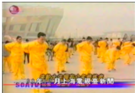
▲ 1998 年 11 月 24 日上海电视台报道法轮功已传遍欧、美、澳、亚四大洲，已有 1 亿人在炼法轮功。