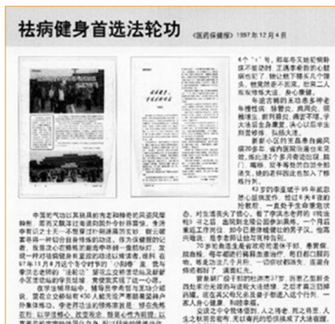
▲《医药保健报》1997年12月4日文章：《祛病健身首选法轮功》。