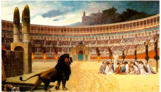
图：《基督殉道者最后的祈祷》：竞技场周围的柱子上，左边是遭受火刑的基督徒，右边是十字架处死的基督徒，中间一群基督徒则将被猛兽撕碎，看台上无数民众毫无同情心地观看着这惨烈的情景。

公元 33 年基督耶稣受难之后，基督徒在古罗马遭受残酷迫害。公元 64 年古罗马暴君尼禄故意纵火焚烧罗马城，嫁祸于基督徒。为了进一步煽起人民对基督徒的仇恨，一些官方学者把基督徒描绘为迷信、反社会、反人类，有政治野心，基督徒只要不放弃信仰就将失去财产，沦为奴隶，失去生命。统治者把基督徒和干草绑在一起点着，或把他们扔到竞技场喂狮子，而许多民众以此为乐。