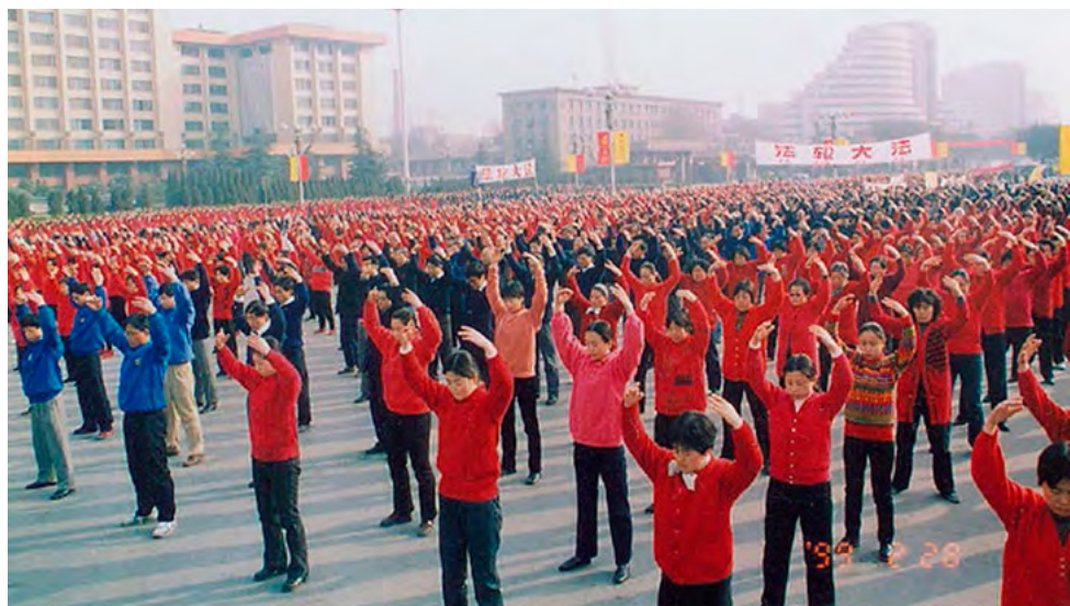
▲ 1999 年 2 月法轮功学员在陕西省政府前新城广场集体炼功。