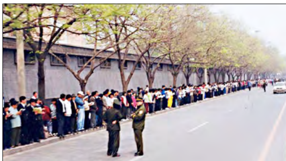
图：1999年4月25日法轮功学员和平上访，整个上访过程秩序良好，交通井然。

出于对政府的信任，法轮功学员4月25日依照宪法赋予的权利来到国务院信访局（中南海旁边）和平上访，希望释放天津学员，给法轮功学员一个宽松的修炼环境。当日，在国务院总理朱镕基的关注下，