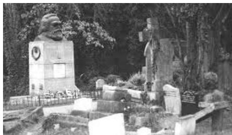
图：马克思死后埋在英国伦敦的高门墓地（Highgate Cemetery，大陆译为“海格特公墓”）。高门墓地是伦敦地区的撒旦崇拜中心，许多崇拜魔鬼的黑色仪式在这个墓地举行。

马克思自己也承认与撒旦签了契约。其后马克思大行魔鬼所为之事：诅咒全人类下地狱，包括工人和那些为共产主义而战的人。所