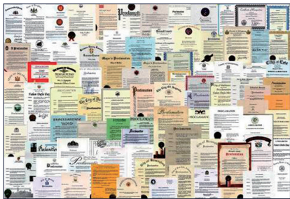
图：来自世界各国的部分褒奖。

● 弘传世界 法轮功已弘传世界 100 多个国家和地区，受到世界人民的喜爱和尊敬，因对人类身心健康做出的杰出贡献，法轮大法获各国政府褒奖、支持议案、支持信函 3500 多项。法轮功书籍被译成 39 种语言在全球出版发行并可在法轮大法网站（ www.falundafa.org ）上免费下载。◇