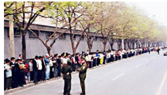
图：1999 年 4 月 25 日上访现场，法轮功学员文明安静，警察不用维持秩序，在一旁聊天。所谓的“围攻中南海”根本就不存在。

4 月 25 日当晚，江泽民出于妒忌，强行推翻政府总理的开明决定，把和平上访歪曲成“围攻中南海”，并于 1999 年 7 月开始全面迫害法轮功。