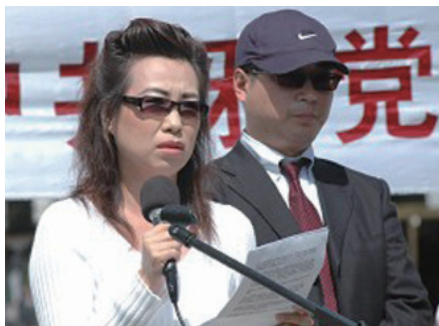
图：2006年4月20日胡锦涛与布什总统会面当天，证人皮特和安妮，公开站出来指证中共劳教所发生大规模活体摘取法轮功学员器官牟取暴利的罪恶。

而在中国，劳动与所得根本不成比例，是中共剥夺了你的劳动所得。因此，不是共产党给你发工资，而是你养着共产党。