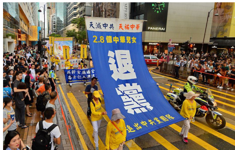
图：2017 年 10 月 1 日香港声援二亿八千万中国民众“三退”

中国的先贤有“君子不立危墙之下”的古训。如今，历史的巨变就在眼前，上天给每个人留下了用良知选择未来的机会，有缘的朋友，希望你不要推开。◇