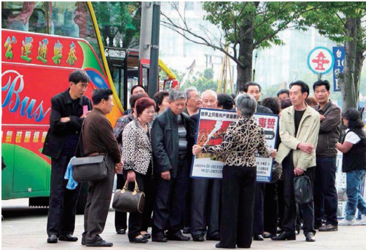
图：许多大陆游客在台湾观看法轮功真相图片并“三退”保平安。

2005 年 3 月 1 日，核工业所属军工系统 46 名党龄 30 至 50 年老干部，郑重宣布退出中共。2005 年“七一”前夕，来自河北、山西、辽宁、吉林、黑龙江的 47 位前中共军官集体退党。这 47 位转业军官中，副师职 1 人，正副团职 4 人，正营职 6 人，副营职及以下的有 36 人。他们说：几年前转业到地方后，经济政治待遇尽失，生活困苦，上访无门，在“三退”大潮的感召下，大家决定集体退党。