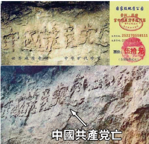
图：“藏字石”石面上呈现出的“中國共產党亡”六个大字清晰可辨，昭示着“天灭中共”的天意。上图是风景区的门票，下图是新华网图片。

国内多家媒体报道，但都隐去“亡”字，“藏字石”的图片还被赫然印在贵州“藏字石”风景区的门票上。