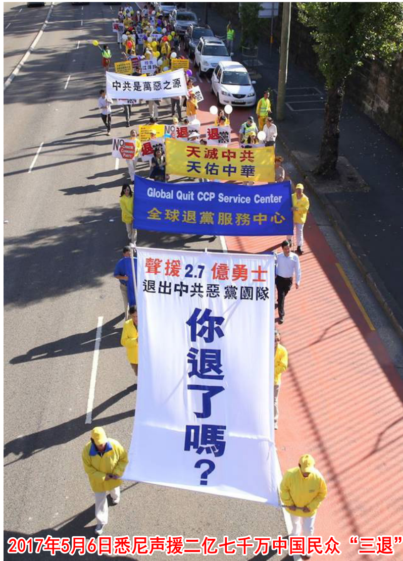
2017年5月6日悉尼声援二亿七千万中国民众“三退”