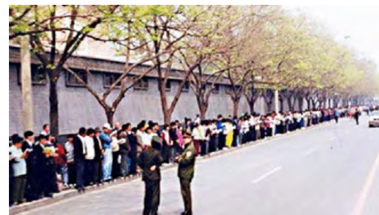
图：1999年4月25日上访现场，法轮功学员文明安静，警察不用维持秩序，在一旁聊天。所谓的“围攻中南海”根本就不存在。

4月25日当晚，江泽民出于妒忌，强行推翻政府总理的开明决定，把和平上访歪曲成“围攻中南海”，并于1999年7月开始全面迫害法轮功。