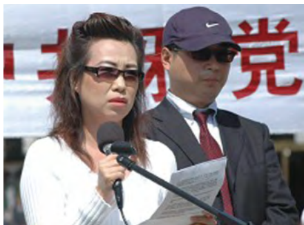
图：2006年4月20日胡锦涛与布什总统会面当天，证人皮特和安妮，公开站出来指证中共劳教所发生大规模活体摘取法轮功学员器官牟取暴利的罪恶。

集中营的一部分，位于吉林的代号为672—S的集中营，关押了超过十二万法轮功学员和异见人士，仅他本人经手伪造的自愿捐献器官资料就有六万多份。