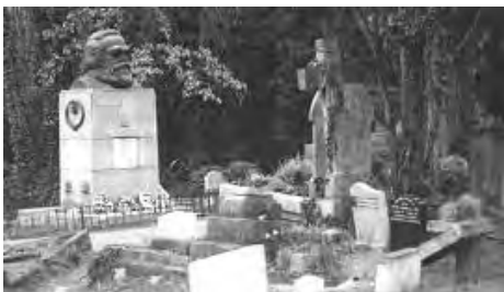
图：马克思死后埋在英国伦敦的高门墓地（Highgate Cemetery，大陆译为“海格特公墓”）。高门墓地是伦敦地区的撒旦崇拜中心，许多崇拜魔鬼的黑色仪式在这个墓地举行。

马克思自己也承认与撒旦签了契约。其后马克思大行魔鬼所为之事：诅咒全人类下地狱，包括工人和那些为共产主义而战的人。所