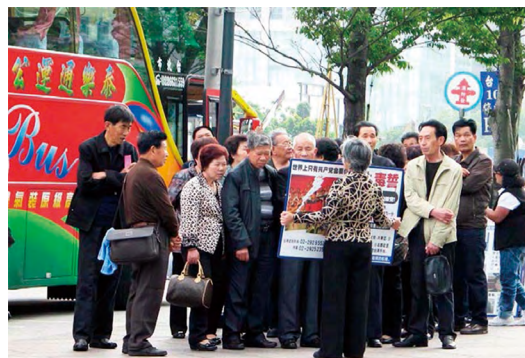
图：许多大陆游客在台湾观看法轮功真相图片并“三退”保平安。

近几年来，北美、欧洲、大洋洲、亚洲各大城市旅游点都有退党中心义务工作人员为大陆游客办理“三退”服务。在欧洲、香港、东南亚地区，出现了中国大陆游客整团、整车退党的现象。出国旅游的相当部分人士是中共各级官员。