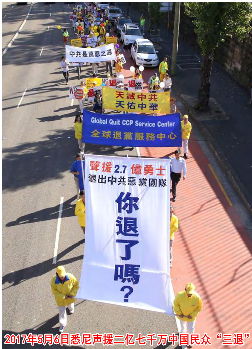
2017年5月6日悉尼声援二亿七千万中国民众“三退”