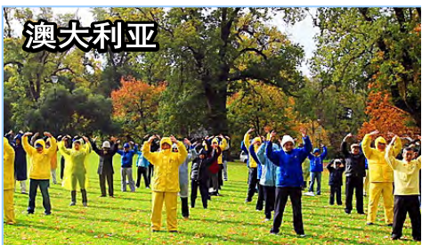
■ 法轮功已弘传世界一百多个国家和地区