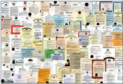
图：来自世界各国的部分褒奖。

● 弘传世界 法轮功已弘传世界 100 多个国家和地区，受到世界人民的喜爱和尊敬，因对人类身心健康做出的杰出贡献，法轮大法获各国政府褒奖、支持议案、支持信函 3500 多项。法轮功书籍被译成 39 种语言在全球出版发行并可在法轮大法网站（ www.falundafa.org ）上免费下载。◇