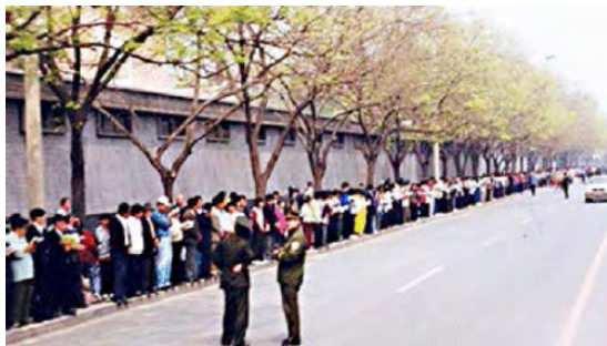
图：1999年4月25日上访现场，法轮功学员文明安静，警察不用维持秩序，在一旁聊天。所谓的“围攻中南海”根本就不存在。

4月25日当晚，江泽民出于妒忌，强行推翻政府总理的开明决定，把和平上访歪曲成“围攻中南海”，并于1999年7月开始全面迫害法轮功。