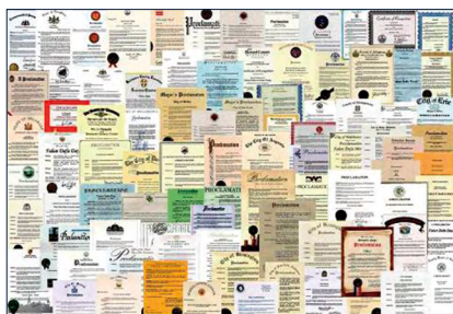
图：来自世界各国的部分褒奖。

● 弘传世界 法轮功已弘传世界 100 多个国家和地区，受到世界人民的喜爱和尊敬，因对人类身心健康做出的杰出贡献，法轮大法获各国政府褒奖、支持议案、支持信函 3500 多项。法轮功书籍被译成 39 种语言在全球出版发行并可在法轮大法网站（ www.falundafa.org ）上免费下载。◇