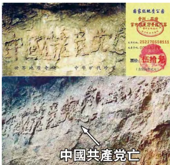
图：“藏字石”石面上呈现出的“中國共產党亡”六个大字清晰可辨，昭示着“天灭中共”的天意。上图是风景区的门票，下图是新华网图片。

国内多家媒体报道，但都隐去“亡”字，“藏字石”的图片还被赫然印在贵州“藏字石”风景区的门票上。