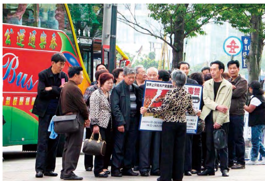
图：许多大陆游客在台湾观看法轮功真相图片并“三退”保平安。

近几年来，北美、欧洲、大洋洲、亚洲各大城市旅游点都有退党中心义务工作人员为大陆游客办理“三退”服务。在欧洲、香港、东南亚地区，出现了中国大陆游客整团、整车退党的现象。出国旅游的相当部分人士是中共各级官员。