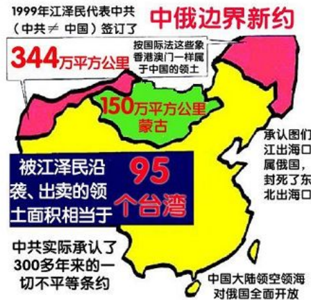
▲ 中共江泽民出卖国土示意图

庶转嫡，中国传统文化和文化人，便成了中共的绊脚石，必欲除之而后逞。这是中共反右打压文化人，文革毁灭传统文化、毁坏文物的根本原因。据统计，在中共反右和文革中不甘受辱、不堪折磨而自杀的文化精英多达 200 多人，有不少是大师级文人学者。他们是传统文化中被称为“士”的阶层，是社会中最富独立思想与人格的那批人。