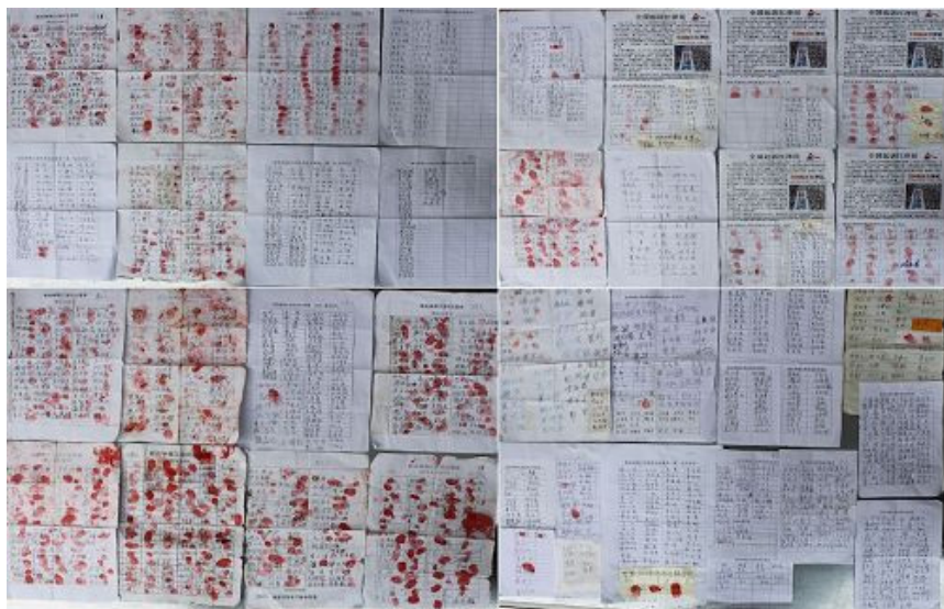
▲ 岳阳市 2246 民众签名或盖手印联名举报江泽民的照像件

【明慧网】岳阳市又有 2246 人签名举报江泽民，举报江泽民的岳阳民众累计已达 9730 人。举报信上签下真实姓名或化名，联名举报江泽民，希望最高检察院尽快立案调查，将迫害法轮功的元凶江泽民绳之以法，还法轮大法公道！