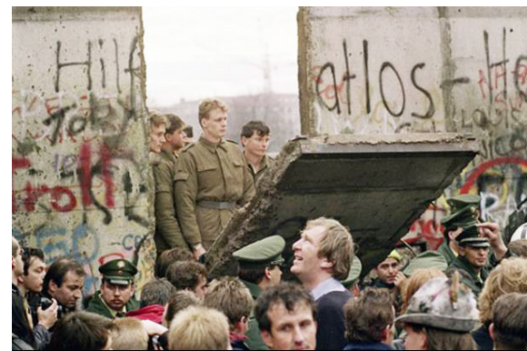
柏林墙倒塌整整27周年