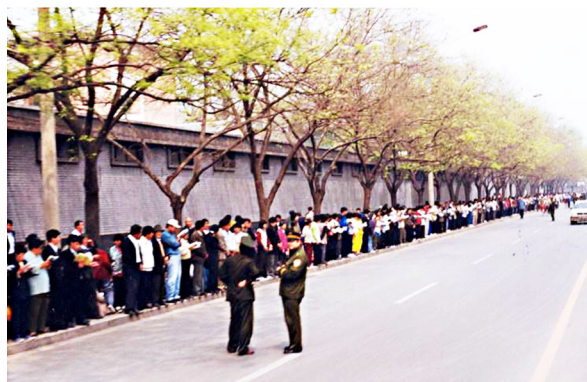
1999年4月25日，万名法轮功学员和平上访，文明安静，秩序井然，警察在一旁聊天。

附近的国务院信访办和平上访，希望释放天津学员，给法轮功学员一个宽松的修炼环境。在时任总理的关注下，问题得到基本解决。当晚，法轮功学员平静离开。上访时，他们没有口号标语，安静祥和，秩序井然；离去时，没有留下任何垃圾，甚至把警察扔的烟头都捡了起来。