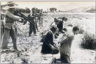
1953 年，中共军管人员在新疆阜康枪杀地主和“反革命分子”。