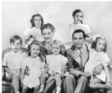
纳粹宣传部长戈培尔一家

纳粹德国覆灭之前的最后几个小时里，有大量德国人走向自杀之路，其中包括约瑟夫·戈培尔，他是纳粹的宣传部长，从1944年7月开始还担任“总体战动员委员会全权总监”，在希特勒自杀不久，他和妻子玛格塔一起自杀。更令人唏嘘的是，两人结束生命之前毒死了他们的五个女儿与一个儿子，最大的12岁，最小的4岁。