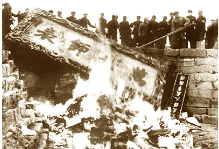
孔子在山东曲阜安息了2400多年，在共产党执政后竟然成为被批斗对象。孔子故居遭打砸，6000多件文物被毁坏。图为“万世师表”匾额（清朝康熙大帝手书）在文革中被焚毁。