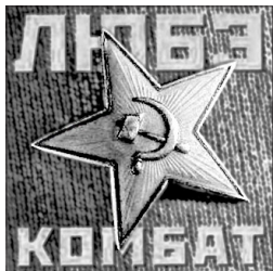
苏共标志，五角星里的镰刀象征恶魔。

共产党的很多组织原则、入党仪式，都源于光照帮的帮规。撒旦教或光照帮，从入教、入帮开始，都需发毒誓：把生死交给组织（魔），无条件服从上级，忠于组织，严格保密，定期向上司汇报思想等。◇