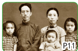
民国大师陈寅恪与妻女