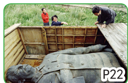
斯大林塑像被拆除