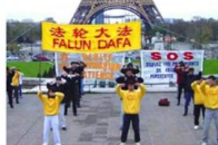
法轮大法 FALUN DAFU