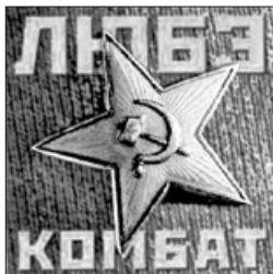
苏联共产党的标志，五角星里的镰刀象征恶魔。

共产党的很多组织原则、入党仪式，都源于光照帮的帮规。撒旦教或光照帮，从入教、入帮开始，都需发毒誓：把生死交给组织（魔），无条件服从上级，忠于组织，严格保密，定期向上司汇报思想等。◇