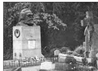
马克思死后葬身英国高门墓地,只有六个人参加了其葬礼。该墓地是伦敦地区的撒旦崇拜中心,许多崇拜魔鬼的黑色仪式在此举行。