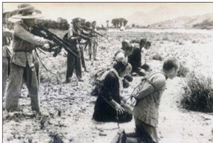
1953 年，中共军管人员在新疆阜康地区枪杀地主和“反革命分子”。