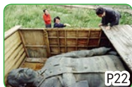
斯大林塑像被拆除