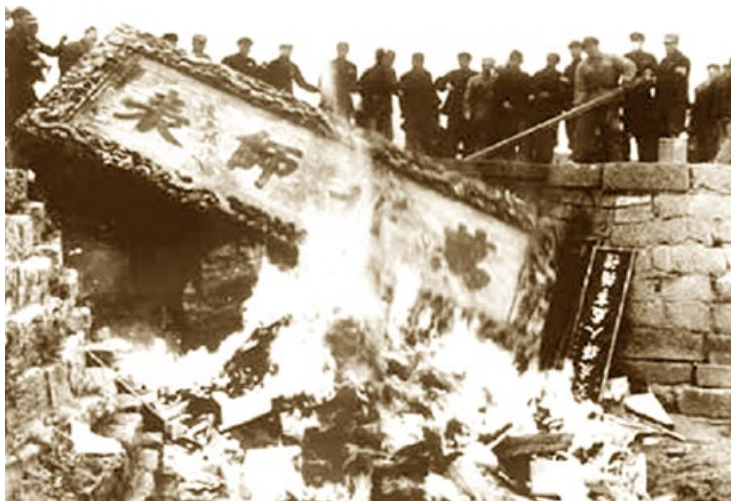
孔子在山东曲阜安息了2400多年，在共产党执政后竟然成为被批斗对象。孔子故居遭打砸，6000多件文物被毁坏。图为“万世师表”匾额（清朝康熙大帝手书）在文革中被焚毁。