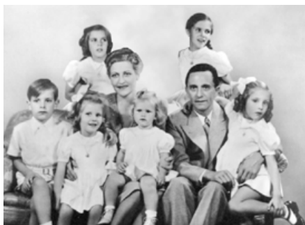
纳粹宣传部长戈培尔与妻子、孩子

纳粹德国覆灭之前的最后几个小时里，有大量德国人走向自杀之路，其中包括约瑟夫·戈培尔，他是纳粹的宣传部长，从1944年7月开始还担任“总体战动员委员会全权总监”，在希特勒自杀不久，他和妻子玛格塔一起自杀。更令人唏嘘的是，两人结束生命之前毒死了他们的五个女儿与一个儿子，最大的12岁，最小的4岁。