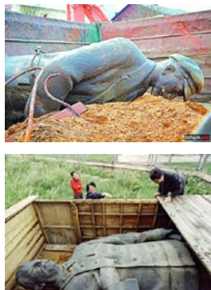
上：乌克兰拆毁列宁像 下：蒙古将位于首都中心的斯大林像移除

全球数千共产主义相关雕像被推倒或炸毁。图为德国柏林工作人员将马克思塑像移走。来自西方的共产主义和共产党，作为一种邪说和邪恶组织祸乱人间 100 多年，遭全球唾弃。目前，全球只剩四个共产党国家——古巴、越南、朝鲜、中国。