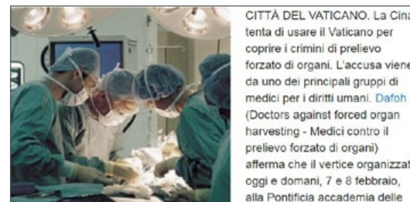
国际媒体广泛报道中共强摘、贩卖法轮功学员人体器官的罪行。图为意大利全国性大报《共和报》的网站报道截图。