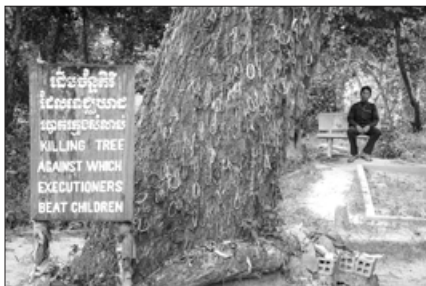
柬埔寨金边“杀人场”的大树，当年孩童被倒提双脚在树上摔死。