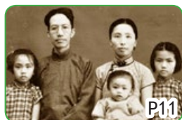
民国大师陈寅恪与妻女