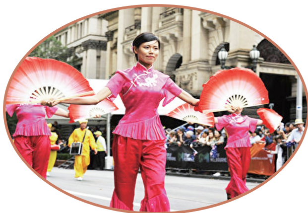
天国乐团 功法展示 扇子舞 腰鼓队