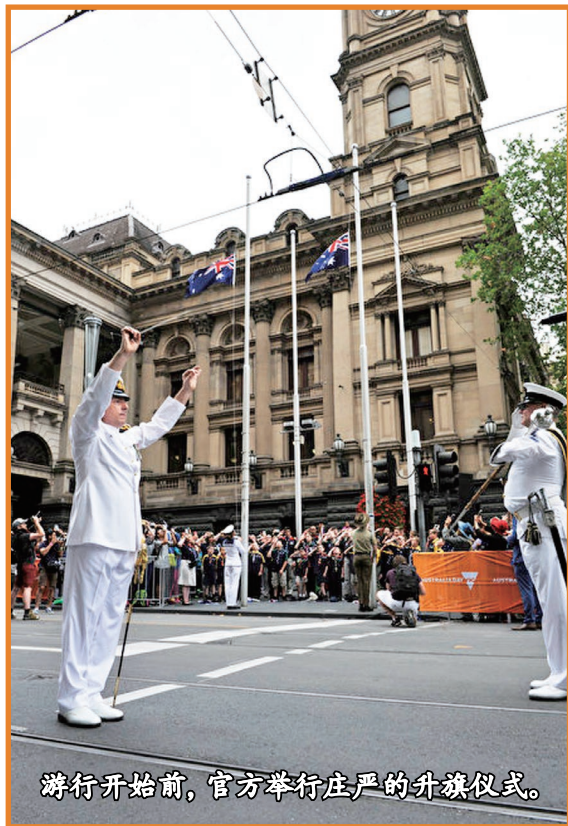
游行开始前，官方举行庄严的升旗仪式。