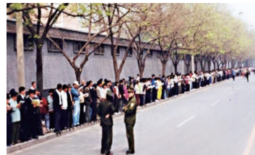
四·二五上访现场，没有标语、口号，井然有序。

法轮功学员所表现出的和平理性和对正信的坚守，得到了国际社会的高度评价，称“四·二五”是“中国上访史上规模最大、最理性平和的上访”。而江泽民出于妒忌，强行推翻政府总理的公开决定，与罗干勾结，于1999年7月20日发动了对法轮功的全国性的大迫害。