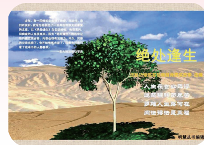
明慧丛书：《绝处逢生》

本书收集的这些故事均采编于明慧网 www.minghui.org ，本书也是“明慧丛书”系列的一集。这些故事仅仅是沧海一粟，因为在当前中国大陆的迫害尚未结束的情况下，很多修炼者暂时还无法将他们自己的经历写出来发表供更多的人借鉴。