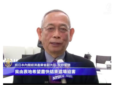
图 1: 前日本经济产业省副大臣牧野圣修观看了影片后由衷地希望尽快结束这场迫害