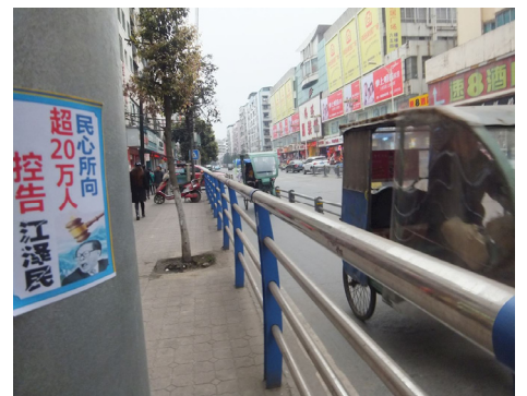
四川遂宁地区的控告江泽民粘贴

有一次，法轮功学员来到一个乡村挨家挨户征签，遇到一位四十多岁的男子正在家里招待客人吃午饭，法轮功学员向他们讲述了江泽民利用中共邪党疯狂迫害法轮功的事实真相。男主人兴奋地说：“法轮功是最好的，江泽民是最坏的。我们全家都签名举报江泽民，支持法轮功做好人。”随后几位客人也纷纷签名按手印，表示支持法轮功。◇