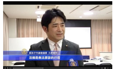
图 2: 久野晋作议员接受新唐人采访表示:活摘是无法原谅的行径

制作了此影片,他将中共对法轮功的迫害上升到世界级问题的高度。我由衷地希望尽快结束这场迫害。”