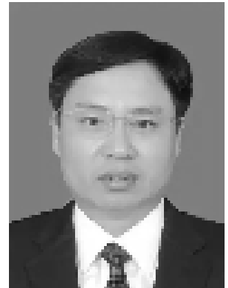
三门县县委书记杨胜杰

据了解，二零一六年十一月上任的三门县县委书记杨胜杰当日出现在了法庭之内，直接“指挥”开庭。当日下午，浙江省台州市市国保人员也出现在了法院。据了解，浙江省国保也参与了此案，中共不法人员欲将此案做成“台州”第一大案。