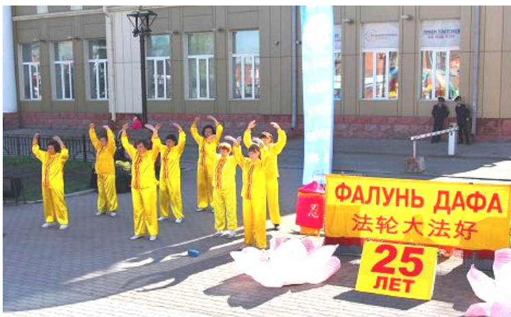
伊尔库茨克市学员们的活动包括功法表演、舞狮子等, 得到市民喜爱

【明慧网】二零一七年五月十二至十四日, 俄罗斯西伯利亚地区各城市法轮功学员们在各自的城市都举行了庆祝活动, 庆祝法轮大法弘传世界 25 周年并祝贺师父华诞。