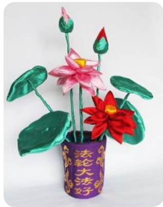
法轮功学员手工艺品 绸缎花《盛开的莲》