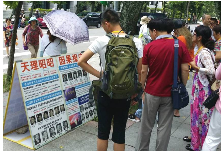
▲台湾国父纪念馆外，大陆游客认真阅读法轮功真相展板

一位年约六七十岁的大陆游客走近法轮功真相点，法轮功学员问他：“你肯定听过法轮功吧。那您说法轮功教人做好人、做好人中的好人，没错嘛！迫害好人的