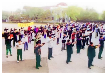
◎ 中共迫害法轮功前，清华大学有11个炼功点，众多教授、博士生、本科生等自发参加晨炼。

风雨18年，清华人守护着“真善忍”的理念。有一种超脱叫“舍生取义”；有一种坚定叫“心如止水”；有一种悲壮叫“百死无悔”。这就是他们的操守。