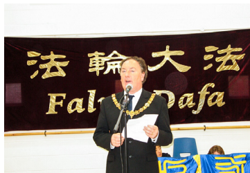
◎ 剑桥市长褒奖：法轮功用真诚彰显信仰的普世价值；感谢法轮功学员为社区做出的贡献。