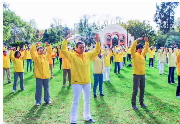
◎ 在世界各地，无论是著名景点，还是广场、公园，都可看到各族裔法轮功学员们炼功的身影。