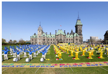
◎ 加拿大政要赞誉：法轮大法打动无数人的心。图为法轮功学员在加拿大国会山前集体炼功。