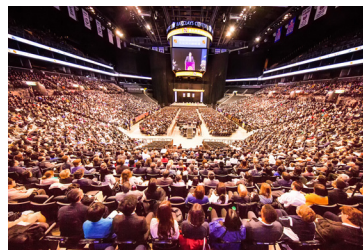
◎ 1 万多名来自世界各地的法轮功学员在纽约举行修炼心得交流会。图：心得交流会现场。