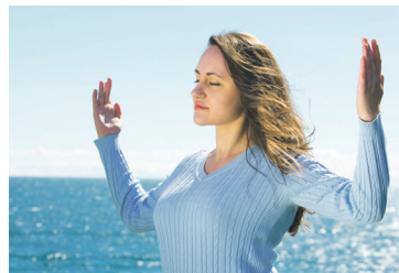
◎ 介绍法轮功的课程被编入南卡罗莱纳大学教学计划中，法轮功成为美国大学的正式课程。