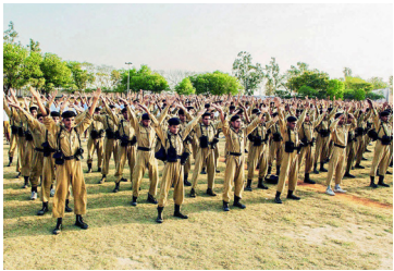
◎ 在自古有佛国之称的印度，法轮功备受欢迎。图为印度警官大学学生在集体炼法轮功功法。