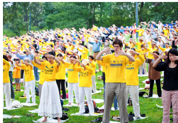
◎ 清晨，美国纽约曼哈顿中央公园碧绿的草坪上，几百名法轮功学员随着炼功音乐，集体炼功。