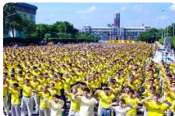
◎ 近万名法轮功学员在台湾总统府前集体炼功。法轮功传入台湾，迄今有 50 多万人修炼。