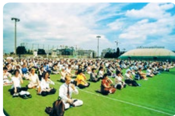
◎ 法轮大法弘传欧洲 46 个国家，法轮功炼功点到处可见。图为法轮功学员在法国巴黎集体炼功。