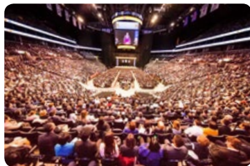
◎ 2017 年 5 月，1 万多名来自世界各地的法轮功学员在纽约举行修炼心得交流会。图为交流会场。