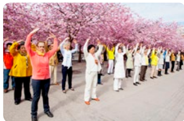
◎ 皇家花园美丽的樱花树下，瑞典法轮功学员集体炼功，祥和的场面成为一道靓丽的风景。