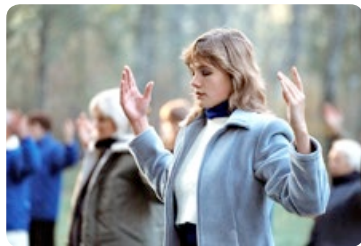
◎ 海外许多城市的公园、绿地，经常看到炼功人的身影；悦耳的音乐传递着祥和的韵律。