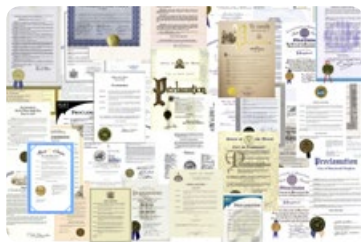
◎ 法轮功获各国政府褒奖。加拿大前总理哈珀盛赞：法轮功学员把法轮大法的福祉展现给人们。