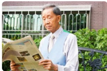
◎ 马先生每天清晨到公园炼功，有时间就读《转法轮》一书。图：102岁的马先生在看报纸。