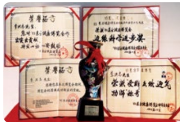
◎ 1993年东方健康博览会，法轮功创始人李洪志先生获最高奖项“边缘科学进步奖”等。

就在生命将到尽头时，马先生开始修炼法轮功，几个月后严重的心脏病、前列腺肥大等病全没了。儿女们看到无病一身轻的父亲，每天心情快乐，炼功，看书，生活起居井井有条，都深感欣慰。马先生说：“修炼法轮大法近20年，这是我这一生最感幸福、美好的日子。”黄昏暮年，否极泰来，夕阳无限，并无唏嘘惆怅，这样的晚年，谁说不是人生的一大福分呢？！