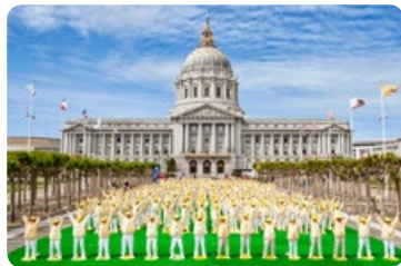
◎ 美国旧金山湾区的几百名法轮功学员，在旧金山市政厅广场集体炼功，场面祥和，壮观。