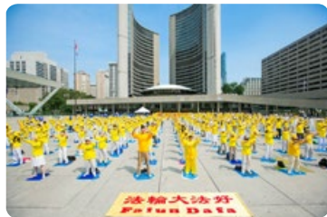
◎ 法轮功学员在加拿大多伦多市政府前的飞利浦广场集体炼功，壮观场面吸引了众多市民。

没想到，否极泰来，幸运降临——几个月后的一天，一位大姐带我去她家看李洪志师父的讲法录像。当时我感觉非常舒服。随后，我又读了《转法轮》，觉得我的生命充满了希望，不再孤独、绝望。我每天坚持炼功，读《转法轮》，浑身有劲儿了。两个月后我的胰头癌就消失了，连以前的慢性咽喉炎、胃肠炎等病都好了。我走出了“癌症世家”的宿命，是法轮大法救了我。