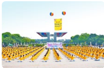
◎ 几百名韩国法轮功学员，聚集在首尔奥林匹克公园里炼法轮功法，场面非常祥和，壮观。