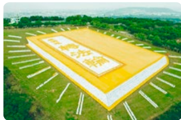
◎ 6000 多名法轮功学员在台湾台中市外埔乡排出《转法轮》一书的立体画面，极为壮观。

《转法轮》出版后，短短 23 年时间内，包括中国大陆在内的 100 多个国家和地区一亿多不同族裔的民众，通过阅读不同文种的《转法轮》走入了法轮大法修炼，身心受益。不读《转法轮》，人生有缺憾，这是无数修炼法轮大法的民众的肺腑之言。