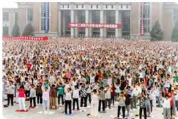
◎ 1998 年 5 月，辽宁省沈阳市一万多名法轮功学员，在辽宁工业展览馆前的广场上集体炼功。