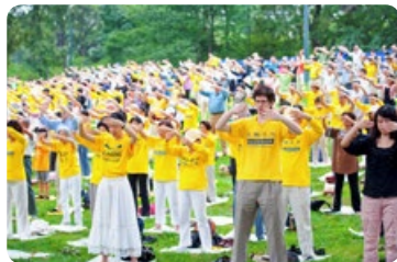
◎ 清晨，美国纽约曼哈顿中央公园碧绿的草坪上，几百名法轮功学员随着炼功音乐，集体炼功。