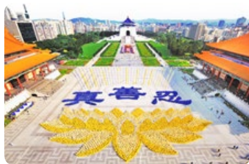
◎ 5000 多名法轮功学员齐聚台北自由广场，排出了优美的莲花座和“真善忍”三个大字。

觅得毕生追寻的佛法真理，敖医师说：“对我而言，法轮功比空气还珍贵。法轮功的功法只有五套，虽然看似简单，但内涵却很高深，需全身极度放松，让身心回归最佳状态。”他一再强调，身体的改变还是其次，重要的是“心”的改变，用“真善忍”要求自己，学会忍耐与放下执著心，凡事不计较，心灵自在了，身体也跟着自由了，身心愉悦。