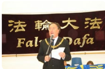
◎ 剑桥市长褒奖：法轮功用真诚彰显信仰的普世价值；感谢法轮功学员为社区做出的贡献。