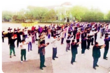
◎ 中共迫害法轮功前，清华大学有11个炼功点，众多教授、博士生、本科生等自发参加晨炼。

风雨18年，清华人守护着“真善忍”的理念。有一种超脱叫“舍生取义”；有一种坚定叫“心如止水”；有一种悲壮叫“百死无悔”。这就是他们的操守。