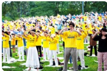
◎ 清晨，美国纽约曼哈顿中央公园碧绿的草坪上，几百名法轮功学员随着炼功音乐，集体炼功。