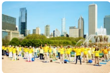
◎ 美国芝加哥法轮功学员，聚集在当地著名景点白金汉喷泉广场上，集体炼法轮功五套功法。