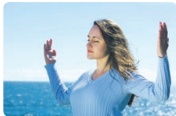
◎ 介绍法轮功的课程被编入南卡罗莱纳大学教学计划中，法轮功成为美国大学的正式课程。