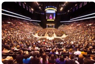
◎ 1 万多名来自世界各地的法轮功学员在纽约举行修炼心得交流会。图：心得交流会现场。