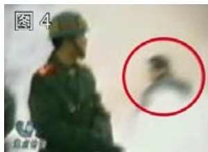
凶手保持用力姿势