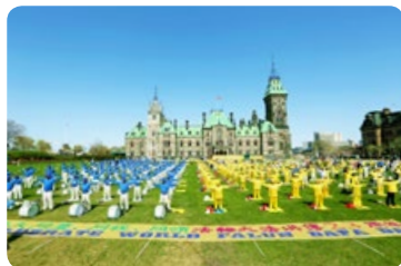
◎ 加拿大政要赞誉：法轮大法打动无数人的心。图为法轮功学员在加拿大国会山前集体炼功。