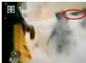
凶手猛击刘的头部

2001 年 8 月 14 日，国际教育发展组织（IED）在联合国会议上，就 2001 年 1 月发生在北京的“天安门自焚”事件，强烈谴责中共的“国家恐怖主义”行为，并声明说：自焚事件的录像分析表明，整个事件是“政府一手导演的”。在场的中共代表面对确凿证据，没有辩辞。该声明已被联合国备案。