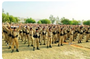
◎ 在自古有佛国之称的印度，法轮功备受欢迎。图为印度警官大学学生在集体炼法轮功功法。