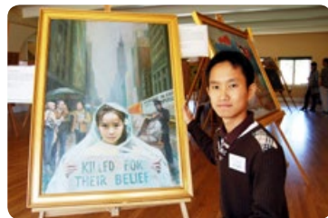
◎ 河哲元最喜爱“纯真的呼唤”这幅画作，画中女孩在呼吁人们关注并制止中共迫害法轮功。