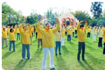
◎ 在世界各地，无论是著名景点，还是广场、公园，都可看到各族裔法轮功学员们炼功的身影。