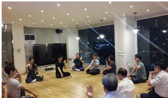
■ 在法轮功学习班上，新老学员们集体打坐炼功。

修炼之前，他在医院接受了痴呆症检查，指数高达10，修炼法轮功后，发现指数竟降为零。对此结果，医生大为震惊，并询问是什么原因引发了这样的奇迹。老先生现在痴呆症症状完全消失了，而且他的变化不止是身体方面的，他说自己以前整天都在抱怨，而现在抱怨