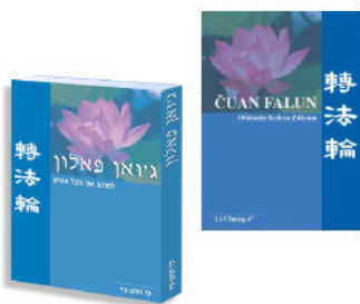
▲希伯来语和斯洛伐克语《转法轮》