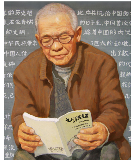
油画：了解真相的老人