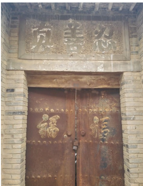
■ 图片：门匾上的“真善忍”

2012年，我退休后常回老家，发现了这个情况后，我立即把盖在“真善忍”三个字上面的白灰清理了，让“真善忍”三个大字又重新显现出来。我也给村干部及周围的人讲真相，讲自己的修炼体会，乡亲们认清了邪党的谎言，也知道了法轮功是