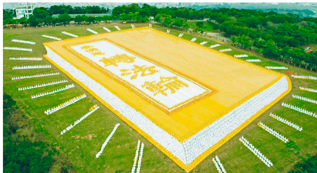
△ 6000 多名法轮功学员在台湾台中市外埔乡排出《转法轮》一书的立体画面，极为壮观。

《转法轮》出版后，短短 23 年时间内，包括中国大陆在内的 100 多个国家和地区近一亿不同族裔的民众，通过阅读不同文种的《转法轮》走入了法轮大法修炼，身心受益。不读《转法轮》，人生有缺憾，这是无数修炼法轮大法的民众的肺腑之言。