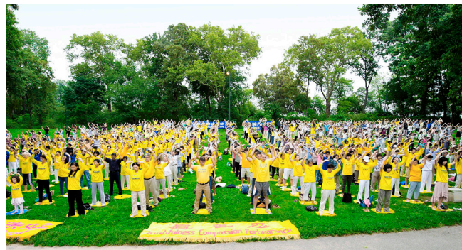
△ 海外许多城市的公园、绿地，经常看到炼功人的身影；悦耳的音乐传递着祥和的韵律。

几个月后的一天，一位大姐带我去她家看李洪志师父的讲法录像。当时我感觉非常舒服。随后，我读了《转法轮》（法轮功著作），觉得我的生命充满了希望。我每天读《转法轮》，坚持炼功，浑身有劲儿了。两个月后，我的胰头癌消失了，连以前的慢性咽喉炎、胃肠炎等病都好了。我走出了“癌症世家”的宿命，是法轮大法救了我。