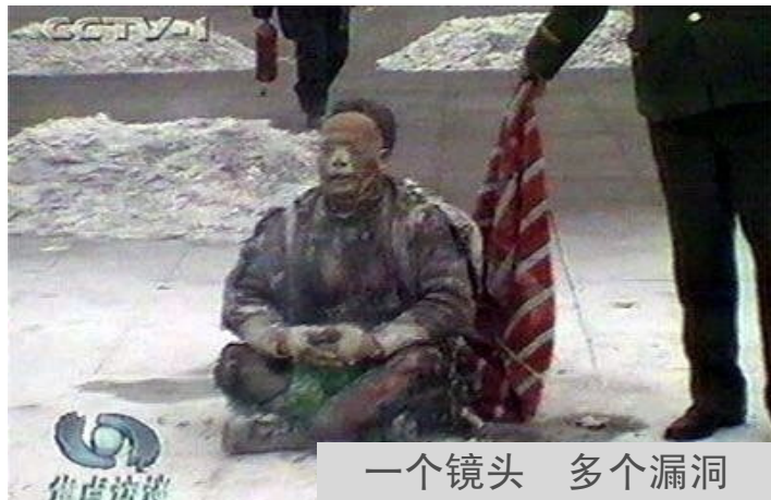
一个镜头 多个漏洞

上都是私心，修炼就是修去私心、提高道德的过程，是内心实实在在的净化和升华。在这个过程中，我渐渐体会到放下执著的轻松快乐，感受到内心的充实和平静。感恩师父让我们走入修炼。◇（文/大陆法轮功学员）