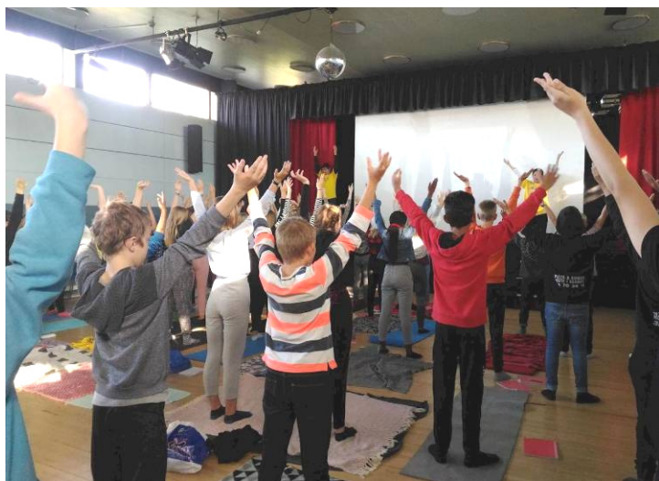
图：法轮功学员在丹麦学校教练法轮功五套功法

法轮功学员向师生们讲解了，法轮功是源自中国的传统修炼功法，按照“真、善、忍”修炼，并告诉孩子