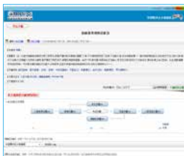
■ 图为该报道网络截图

■ 《今日中国：中文版》1993 年第 7 期（36～38 页）曾以《治病显奇效的法轮功》为题报道法轮功与法轮功创始人李洪志大师。