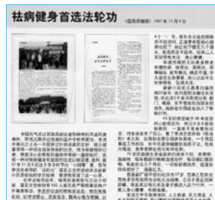
■ 中国大陆《医药保健报》1997 年 12 月 4 日的一篇报道。

交谈之中令笔者体悟到：人之将老、死之将至，人生之秋阴云密布，无以寄托的恐惧换成了有幸修炼法轮大法，病奈我何的旷达。来到炼功场地，仍是绿树葱茏河水清悠，世外桃源人间净土般的境界。◇