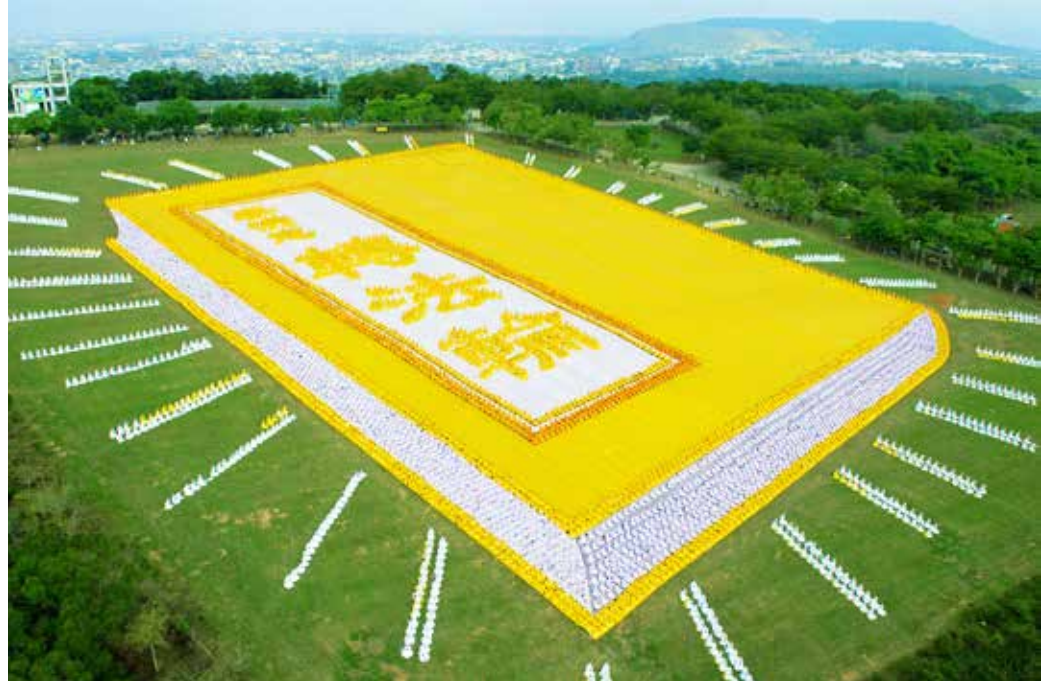
■ 2009年，来自台湾及外岛金门、澎湖等地约6000余名法轮功学员在南台湾风光明媚的垦丁风景区埔顶大草原，排字炼功，组成《转法轮》书模。

法轮功不收分文，义务教功；学炼者来去自由，不记名册。目前，法轮功已弘传世界100多个国家，和港、澳、台，赢得了世界各族裔民众的爱戴和尊敬，可是自1999年后在中国大陆却受到残酷迫害。