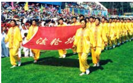
■ 沈阳，1998年亚洲体育节开幕式。