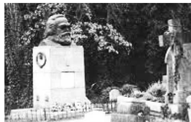
▲马克思死后埋在伦敦的高门墓地。高门墓地是伦敦地区的撒旦崇拜中心，许多崇拜魔鬼的黑色仪式在这个墓地举行。

马克思在《共产党宣言》的开头第一句就说：“一个幽灵，共产主义的幽灵，在欧洲游荡”。共产党的老祖宗都说共产党是魔鬼幽灵，也就是邪灵。这个邪灵在另外空间的显象是红色恶龙（赤龙），