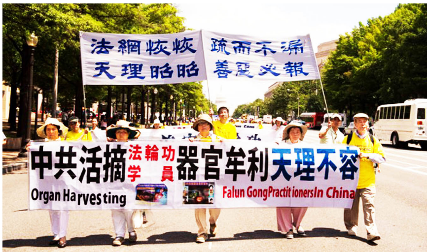
▲ 2014年7月17日法轮功学员在美国首都华盛顿反迫害大游行。

● 弘传世界 法轮大法已弘传世界100多个国家和地区，受到世界人民的爱戴和尊敬。李洪志先生和法轮大法因对人类身心健康做出的杰出贡献，获各国政府褒奖、支持议案和信函3600多项。