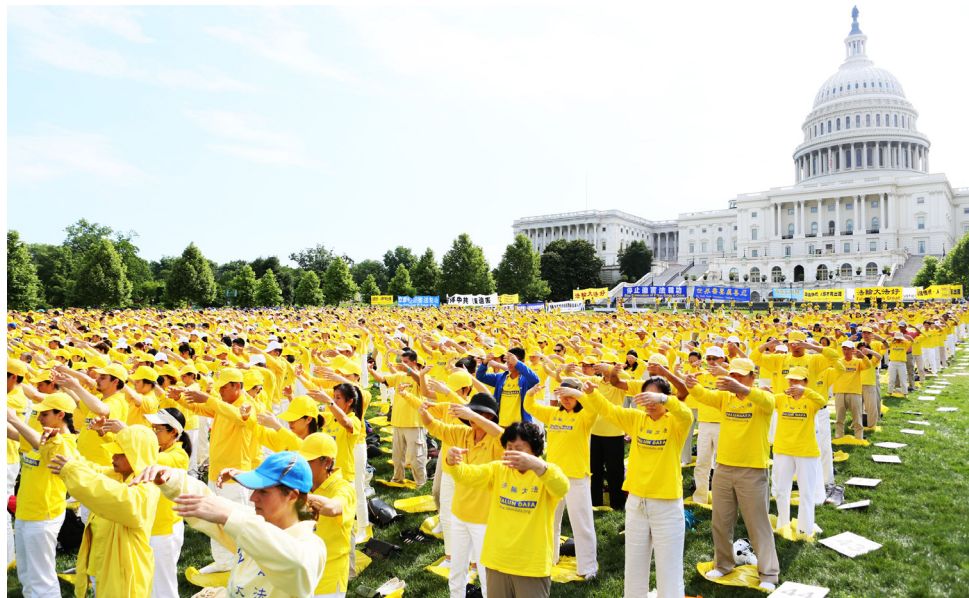
▲ 2018年6月20日，法轮功学员在美国国会山前集体炼功。

中国比较著名的预言包括：周朝的《乾坤万年歌》，汉代诸葛亮的《马前课》，唐代李淳风的《推背图》，宋代邵雍的《梅花诗》，明代刘伯温的《烧饼歌》等。在外国比较著名的预言有：《圣经·启示录》，法国诺查丹玛斯留下的《诸世纪》，韩国的《格庵遗录》等。众多的预言，