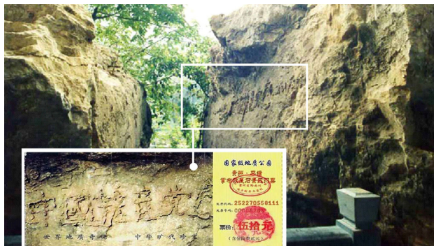
▲上图为“藏字石”照片，小图为风景区门票。

2002年6月，在贵州省平塘县掌布乡发现了距今2亿7千万年的“藏字石”，五百年前崩裂的巨石断面内惊现六个排列整齐的大字“中國共產党亡”，其中那个“亡”字特别的大。