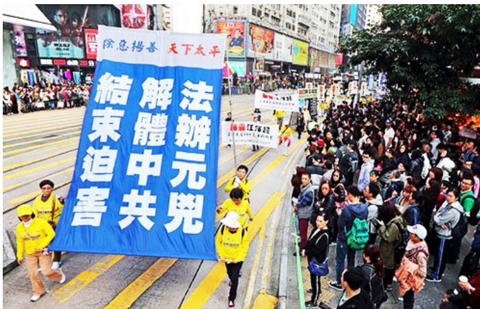
▲ 2017年12月10日，香港法轮功团体在香港中环爱丁堡广场举行反迫害集会游行。

江泽民靠谎报简历起家，当然害怕“真”；以镇压民众而飞黄腾达，当然不喜欢“善”；以勾心斗角的党内斗争维持权力，当然不爱听“忍”。江泽民的阴暗心理、独裁权欲、残暴人格和对“真善忍”的恐惧与嫉妒成为江泽民无端发起迫害法轮功的原因。