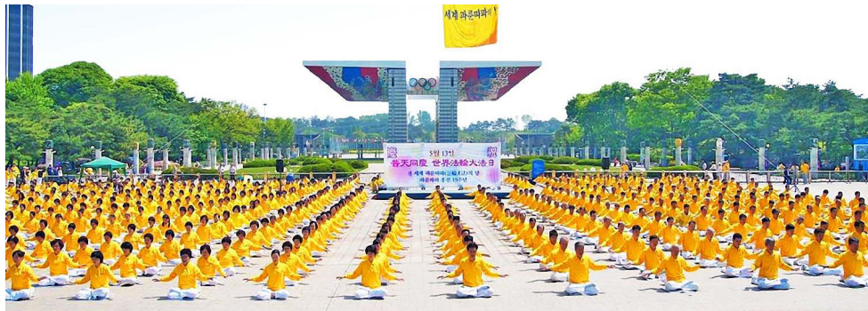
▲韩国法轮功学员在公园里集体炼功。

共产党的所作所为证明它是一个邪教。以阶级斗争、暴力革命、和无产阶级专政为中心的共产党教义，导致了充满血腥暴力与屠杀的所谓共产革命。共产党政权的红色恐怖持续约一个世纪，祸及半个世界，导致数千万至上亿人丧生。