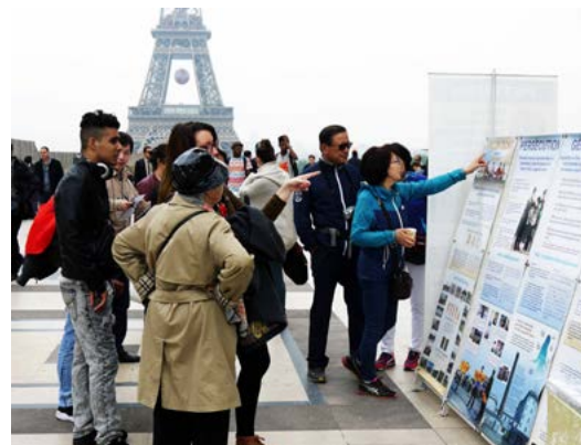
▲成群结队的游客在法国巴黎铁塔下的法轮功真相点观看法轮功真相展板。

在全世界各地著名的观光景点（包括香港、澳门），中国大陆游客常常是整团、整车地三退。目前全球30多个国家和地区已有一百多个退党服务中心，数以万计的志愿者通过各种渠道劝三退，并在世界各地著名旅游区设点，提供义务三退服务。