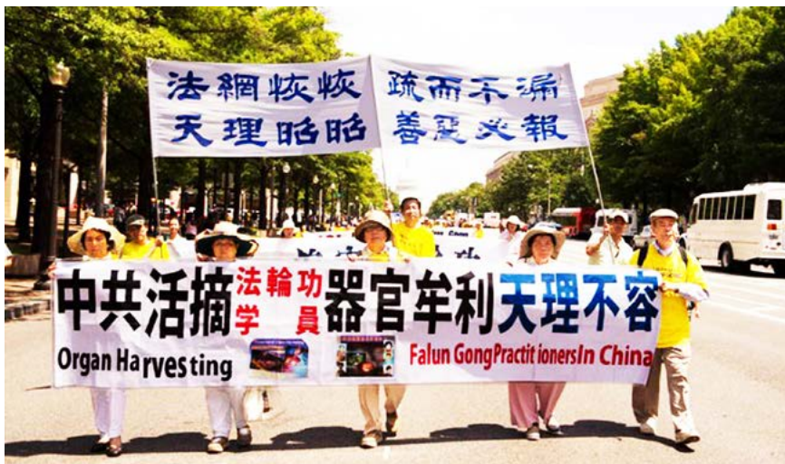
▲ 2014年7月17日法轮功学员在美国首都华盛顿反迫害大游行。

中国比较著名的预言包括：周朝的《乾坤万年歌》，汉代诸葛亮的《马前课》，唐代李淳风的《推背图》，宋代邵雍的《梅花诗》，明代刘伯温的《烧饼歌》等。在外国比较著名的预言有：《圣经·启示录》，法国诺查丹玛斯留下的《诸世纪》，韩国的《格庵遗录》等。众多的预言，