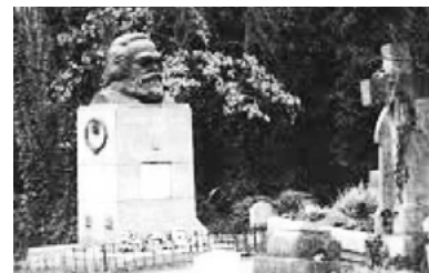
▲ 马克思死后埋在伦敦的高门墓地。高门墓地是伦敦地区的撒旦崇拜中心，许多崇拜魔鬼的黑色仪式在这个墓地举行。

马克思在《共产党宣言》的开头第一句就说：“一个幽灵，共产主义的幽灵，在欧洲游荡”。共产党的老祖宗都说共产党是魔鬼幽灵，也就是邪灵。这个邪灵在另外空间的显象是红色恶龙（赤龙），