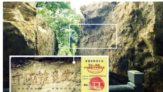
▲ 上图为“藏字石”照片，小图为风景区门票。

● 2002年6月，在贵州省平塘县掌布乡发现了距今2亿7千万年的“藏字石”，五百年前崩裂的巨石断面内惊现六个排列整齐的大字“中國共產党亡”，其中那个“亡”字特别的大。