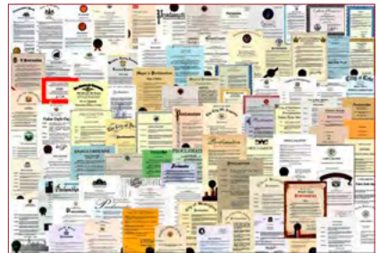
▲ 来自世界各国的部分褒奖。