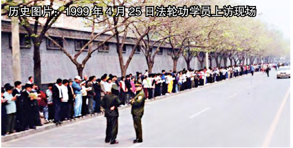
历史图片：1999年4月25日法轮功学员上访现场

中国的民众太老实了，当权者逼迫他们“讲政治”，还随意利用“政治”这顶帽子打压老实的人们。