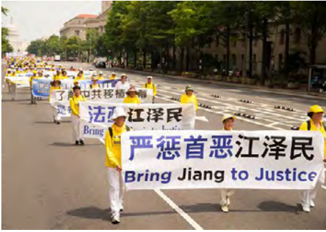
图：2017 年 7 月 20 日法轮功学员在美国首都华盛顿大游行。