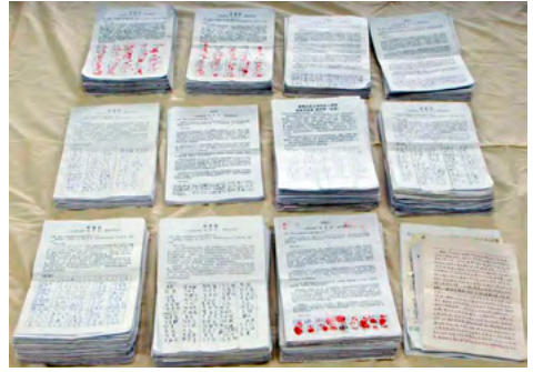
图：河北唐山 45193 人签名举报江泽民。

“全球声援中国民众控告江泽民的刑事举报联署活动”从 2015 年 7 月开始到 2017 年 12 月 8 日，已获得亚洲台湾、韩国、日本、港澳、新加坡、马来西亚、印尼共七个国家和地区，及欧洲 24 个国家，合计共 31 个国家及地区，超过 260 万（2,602,650）民众联署向中国最高法院和最高检察院举报江泽民。其中以台湾 92 万（926,286）人、韩国 67 万（671,422）人和日本 48 万（483,360）人为最多。