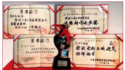
▲ 1993 年北京东方健康博览会上，李洪志先生荣获博览会最高奖项“边缘科学进步奖”。

● 弘传世界 法轮大法已弘传世界一百多个国家和地区，受到世界人民的爱戴和尊敬。因为李洪志先生和法轮大法对人类身心健康做出的杰出贡献，获各国政府褒奖、支持议案和信函 3500 多项。