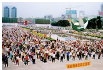
© 1998 年，广州一个炼功点的法轮功学员在炼功。1999 年广州有近 25 万人修炼法轮功。