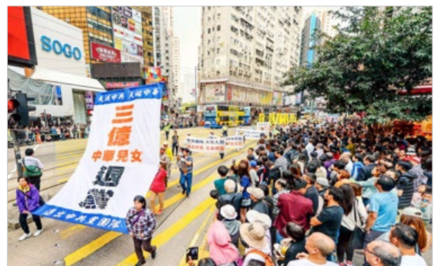
香港法轮功学员 2018 年 3 月 18 日大游行，祝贺 3 亿中国人理智地为自己选择了光明的未来。

◎ 历代的败象，都没有腐败到像中共政权这样猖狂；历代的灭亡，都要带走它的追随者殉葬。贵州省平塘县掌布乡发现了一块距今 2.7 亿年的“藏字石”，500 年前崩裂的巨石断面上露出天然形成的六个大字“中國共產党亡”，昭示着天灭中共的天意。