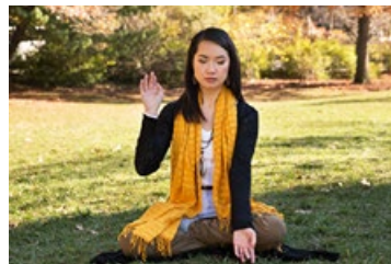
◎ 依力修炼法轮功至今已 20 年了，读《转法轮》和炼功是她生活不可或缺的一部分。