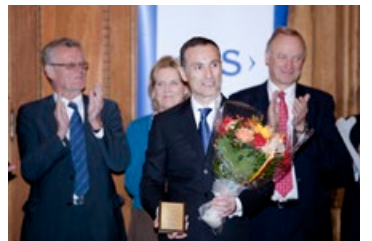
◎ 瑞典国王颁奖者瓦西柳斯说：如果我不修炼法轮功，绝对不能胜任今天的工作。