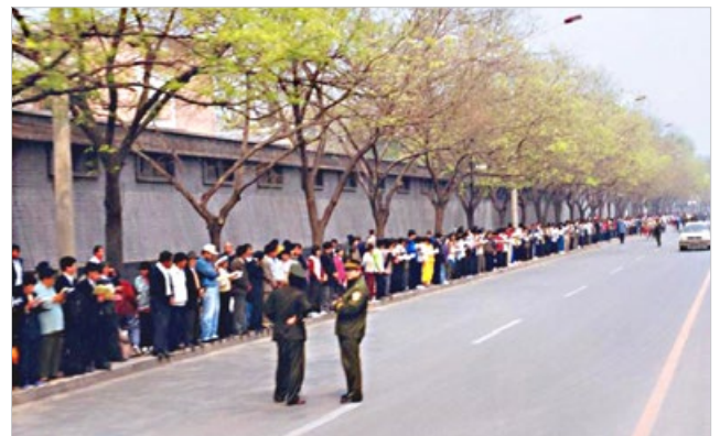
1999年4月25日上访现场秩序井然，警察不用维持秩序。

有人认为法轮功学员上访导致中共迫害，其实不然。江泽民在1996年就预谋迫害法轮功，不断制造事端，直到1999年4月的天津抓人事件。万人和平上访，是法轮功学员在中共迫害升级的情况下，不得已采取的合法的反迫害举动，他们维护的是按“真善忍”做好人的权利，无关政治。