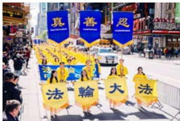
◎ 2017年5月，来自世界各地的法轮功学员在美国纽约举行盛大游行，吸引了众多游客驻足。