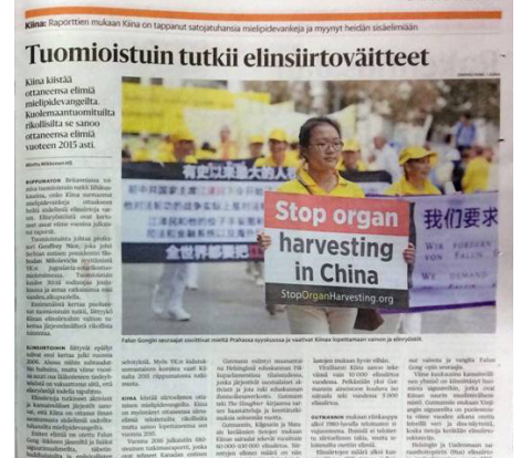
图：芬兰畅销全国的最大影响力报纸《赫尔辛基日报》刊登研讨会报道。

葛特曼先生在近一个小时的演讲中，详细介绍了他们收集法轮功学员被中共活摘器官的确凿证据。并讲述了中共政权下早就有利用政治犯的活体器官为中共高官进行器官移植的做法，根据他与加拿大前亚太司司长大卫·乔高和加拿大人权律师大卫·麦塔斯共同进行的独立调查。葛特曼先生在研讨会还介绍了“活摘”更新调查报告。各种证据指出中共“活摘”的规模之大，有系统性地按需杀人。并揭示中共不停地用谎言和