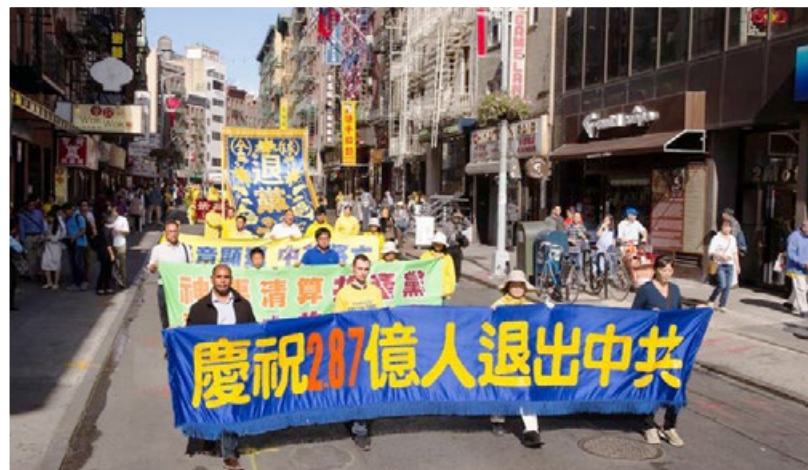
↑ 2017年10月22日，美国纽约曼哈顿游行，声援2.8亿人三退。

2017年大年过后，表哥表嫂来到我家，用U盘复制了法轮功的主要著作《转法轮》和其他法轮功书籍。表哥说：“想一想还是应该炼法轮功。回去会把法轮功的书全看了。我这个岁数，没有别的追求了，官场一切看透。我身体不好，有些病不是医院能治的，人的生命也不是自己想象的。法轮功值得研究，我要好好学一学。”