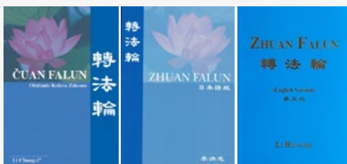
↑《转法轮》斯洛文尼亚文版、日文版、英文版封面

“天梯书店”有售：《转法轮》已被翻译成40种语言，是迄今为止翻译成外国语言文字最多的中文书籍，在各地的法轮大法书籍专营店“天梯书店”都可看到。