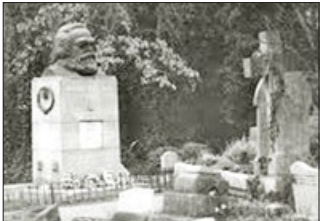
马克思葬身英国高门墓地，此地是撒旦（魔鬼）崇拜中心。

共产党的鼻祖马克思，是邪教信徒，这并非秘密，只是共产党国家故意忽视这一事实。莫斯科马克思学院称，马克思的作品有100卷之多，只有13卷被公开印发。马克思早年曾是基督徒，后加入魔教——撒旦教，马克思主义在其加入魔教后诞生。史料显示，列宁也是邪教信徒，他反对神，崇尚毁灭。