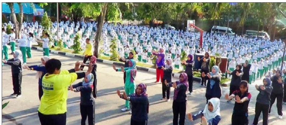
印度尼西亚 巴淡岛最受欢迎的两所中学——卡尔蒂尼高中和特拉丹第一中学1700多名师生学炼法轮功。

荣誉课程是美国大学专门给学术成绩最好、有学习动力的优秀大学本科生准备的，是内容更深、更广、更丰富的专门课程。这是继2016年9月开始的法轮大法修炼课程成人班之后的又一新课程。