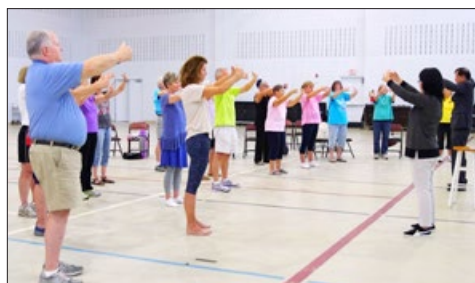
美国南卡罗莱纳大学艾肯分校成人班的学生在炼法轮功，左一是该校终身荣誉校长汤姆·豪尔曼博士。