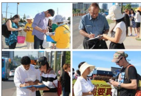
加拿大多伦多民众签名支持法办江泽民