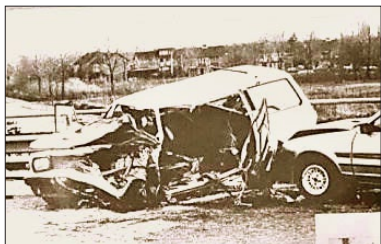
安女士的车祸现场照片。车祸让她昏迷一星期，随后则是 30 年的痛苦。（翻摄 1986 年报纸）