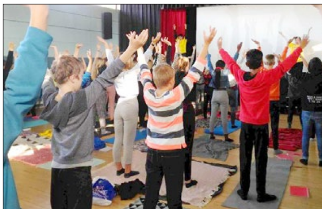
丹麦 国民学校的学生学炼法轮功

中共迫害法轮功之前，中国多所大学包括北大、清华有很多教授和学生修炼法轮功。今天，“真善忍”信仰受到海外师生的欢迎。