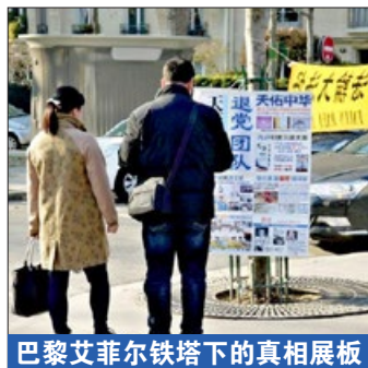
巴黎艾菲尔铁塔下的真相展板