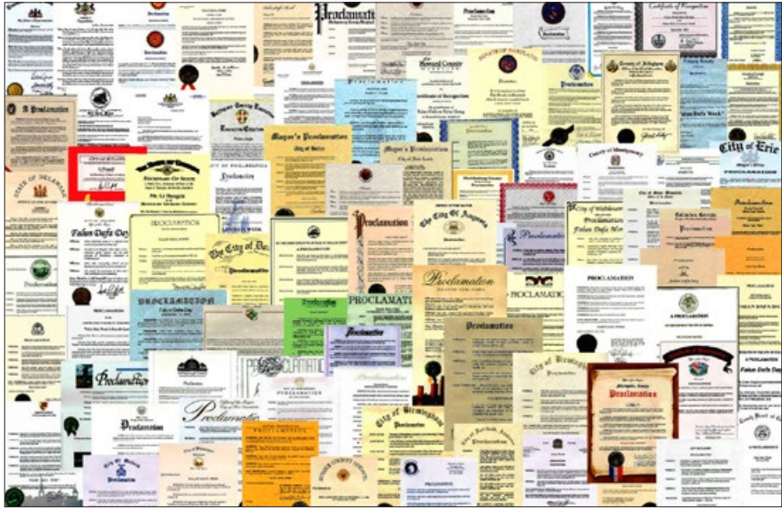
美国各级政府与政要往年给法轮功的褒奖