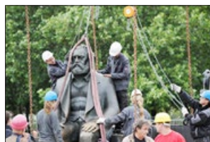
全球数千共产主义相关雕像被推倒、炸毁。图为德国工人正在移除柏林的一座马克思雕像。