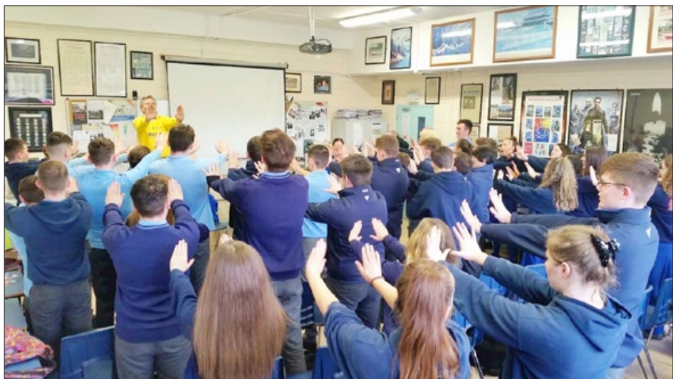
爱尔兰 都柏林 Malahide Community 中学将参加 2018 年高考的学生在炼法轮功。