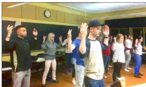
美国 弥赛亚学院的学生炼法轮功