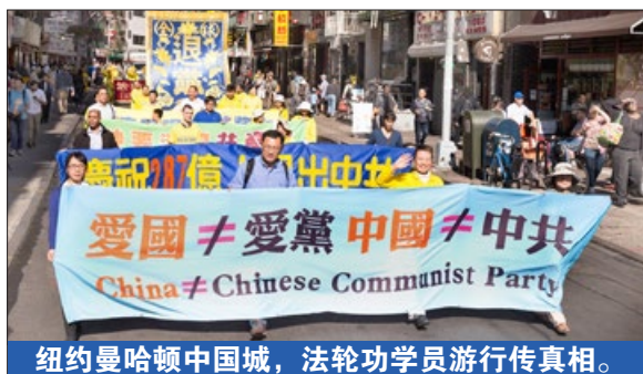
纽约曼哈顿中国城，法轮功学员游行传真相。