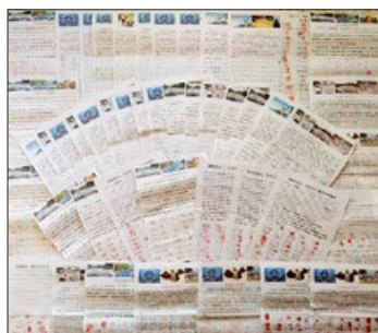
山东民众签名声援控告江泽民