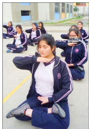
秘鲁 利马女中的学生炼法轮功