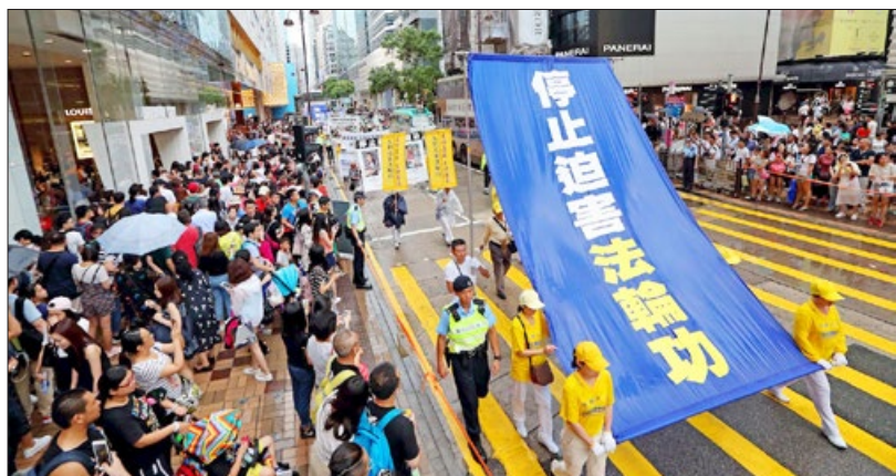
2017年10月1日香港大游行，法轮功学员呼吁停止迫害，法办江泽民。