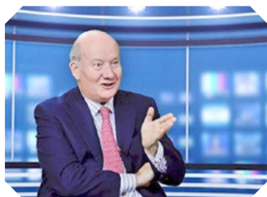
意大利学者因特罗维涅

中共 2017 年 12 月初在武汉召开“国际邪教问题研究学术论坛”。事后，新华社刊登英文文章称，中、美、加、澳、意大利、吉尔吉斯斯坦和斯里兰卡等国的约 30 位学者参加了论坛，并用这些人的身份污蔑法轮功。