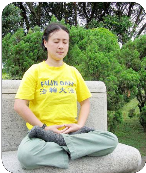
在纸醉金迷中找不到人生方向的雅惠，修炼法轮功之后获得健康的人生。

雅惠发现自己思想观念的尘垢被一层层剥落，身心越来越轻快，思想也越来越清净。她说：“从开始看《转法轮》，我就没有再想