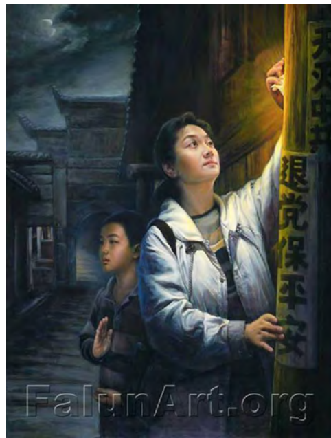
油画《夜的光明》：大陆许多法轮功学员白天上班，很忙。利用晚上时间外出粘不干胶真相标语救人。

当天夜里三点多，急促的敲门声把我叫醒，我问清是派出所所长，开了门，所长快步到我的屋里，在师父的像片前恭恭敬敬地磕了三个头。