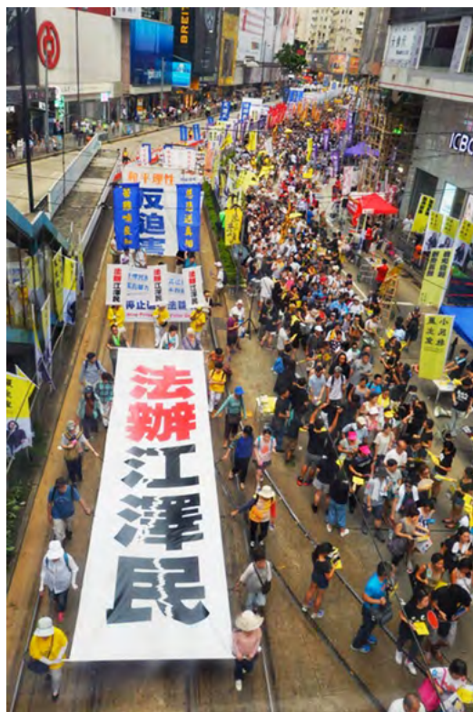
2016年香港七一大游行

第二天，警察来了，他让我把昨天晚上的问话签字、摁手印。我说：先送给你几份材料，这是我的起诉状一份；这是一本《信仰合法 迫害有罪》的法律常识；这份是给派出所全体警察的劝善信及真相资料，希望他们善待法轮大法及法轮功学员，不要助纣为虐，为自己选择个美好的未来。希望你认真地想一想，其实选择与邪恶为伍的后果你是知道的。此时的警察笑了：“你在家学，在家炼吧，我知道怎样做了。”这时我也开心地笑了。