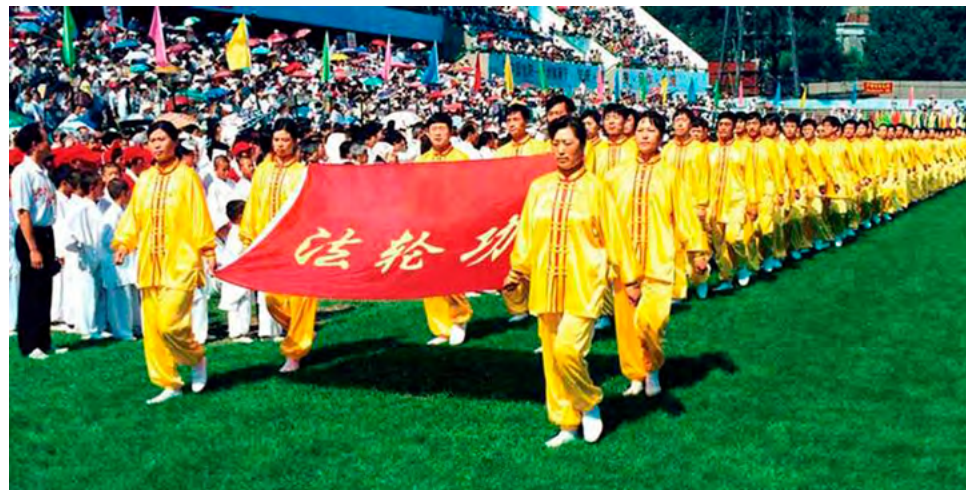
图：1998年8月20日，法轮功学员受邀参加在辽宁省沈阳市举办的亚洲体育节开幕式。8月28日《中国青年报》以“生命的节日”为标题，对此做了报道。

从此以后，我下决心不再干那种丧尽天良的缺德事了，不再按“上级的指示”去执行任务了，曾几次我找借口推掉了，又有一次上级命令我领一帮子警察去抄法轮功学员的家，分工后各自抄一间屋，我