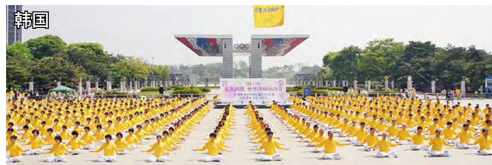
法轮功已弘传世界一百多个国家和地区