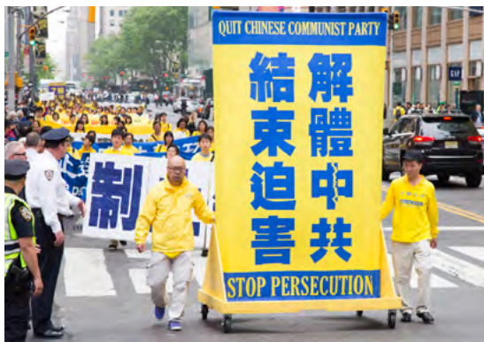
图：2016年5月13日，近万名来自世界五十三国、一百多个地区的法轮功学员在纽约曼哈顿举行反迫害大游行。