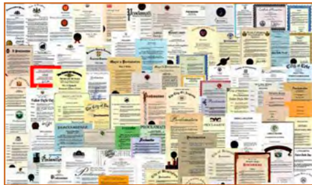
▲ 法轮功获各国政府褒奖、支持议案和信函 3500 多项。上图是来自世界各国的部分褒奖。