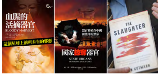
图：国际社会经过严谨的调查取证，出版：《血腥的活摘器官》、《国家掠夺器官》和《屠杀》（或译成《大屠杀》）三本书，详尽地证实了中共活摘法轮功学员器官贩卖的事实。

轮功学员的器官来卖钱不相信，其实对迫害者来说，摘取“阶级敌人”的器官来赚钱，既在政治上和党保持一致，又有“经济效益”，没有什么难理解的。问题是，许多人对中共的残忍程度还认识不清。