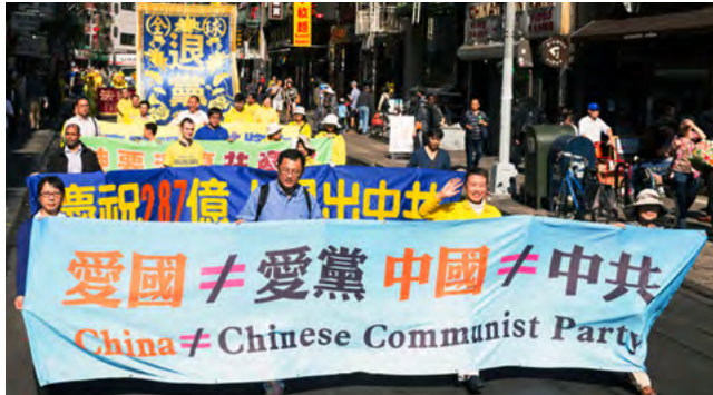
2017年10月22日法轮功学员在曼哈顿中国城游行。

（共产党还故意混淆“党”、“国”概念，使得许多中国人“党”“国”不分，其实中共不等于中国，爱国也不等于爱党），个人必须无条件地服从党，服从党的领袖。每个人要么和党保持一致，要么