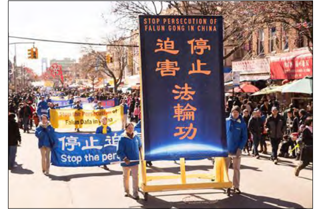
2018年3月11日，近千名法轮功学员来到纽约第三大华人社区布碌伦第八大道举行盛大游行。

制止中共迫害法轮功，让百姓有做好人的自由，有信仰“真善忍”的自由，才是中华民族的出路。