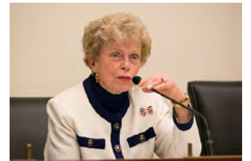
美国国务院前助理国务卿艾伦·索尔布雷

在现场听完法轮功学员的被迫害经历后，曾担任国务院前助理国务卿艾伦·索尔布雷（Ellen Sauerbrey）大使与迟丽华母女紧紧拥抱，她用“令人心碎”、“很