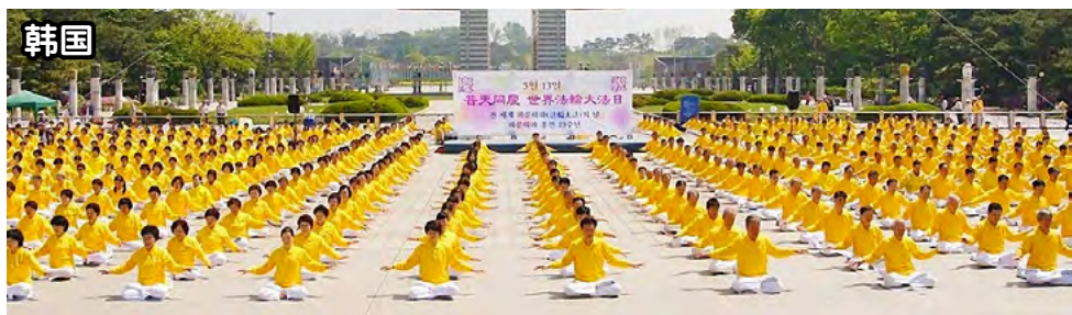
■ 法轮功已弘传世界一百多个国家和地区。