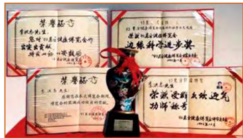
▲ 1993 年北京东方健康博览会上，李洪志先生荣获博览会最高奖项“边缘科学进步奖”。

“真善忍”的信仰得到了世界各族裔民众的爱戴和尊敬，却在中國大陸一地受到残酷迫害。