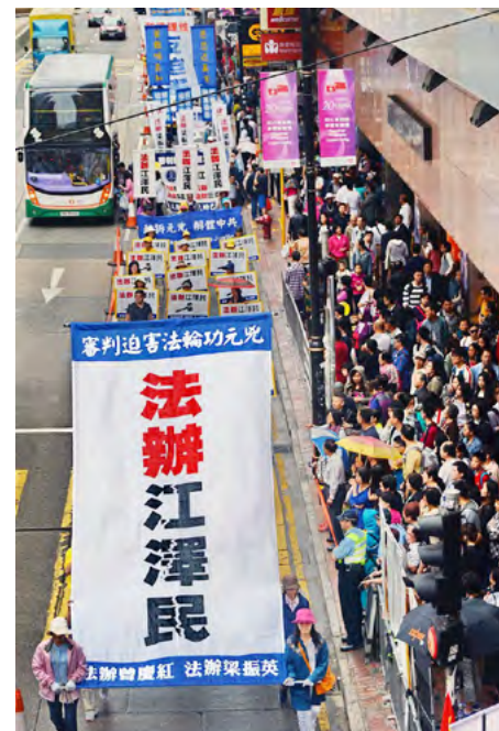
2017年4月23日香港法轮功学员集会游行，纪念4·25法轮功学员和平上访十八周年。

法轮功学员控告江泽民，不仅是作为受害者讨还公道，维护“真、善、忍”普世价值，也是在匡扶社会正义，维护所有中国人做好人的权利。