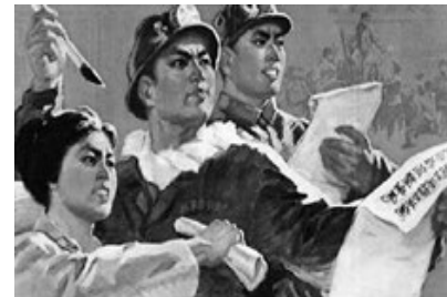
把反击右倾翻案风的斗争进行到底

有 7000 余人被逮捕，有 20000 余人自杀，3500 余人非正常死亡或失踪。（中共中央党史研究室《建国以来历史政治运动事实》）