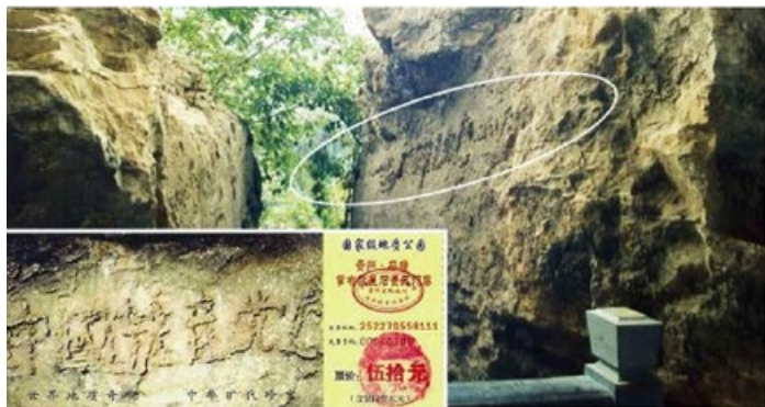
▲ 贵州省平塘县风景区门票及藏字石。

2002年6月，贵州省平塘县掌布乡发现一块巨石，断面惊现6个大字：中國共產黨亡。