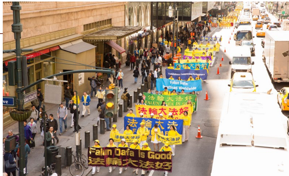
▲ 2017 年 5 月 12 日，万名法轮功学员纽约游行庆祝法轮大法弘传 25 周年。

中共的历史是一部典型的政治运动史与造假谎言史。从 1949 年至今，中共几乎每隔一段时间就要搞一次大规模的政治运动，每一次运动都会制造一批冤假错案，想镇压谁，就镇压谁。法轮功在