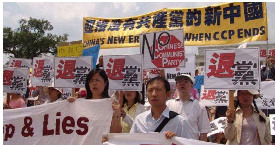
▲ 美国华盛顿法轮功学员反迫害大游行。

2004年11月，海外媒体“大纪元时报”推出了系列社论《九评共产党》，震撼世界。