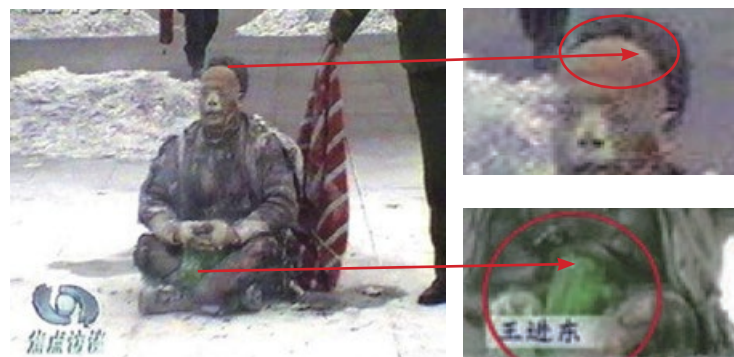
警察晃着灭火毯等镜头