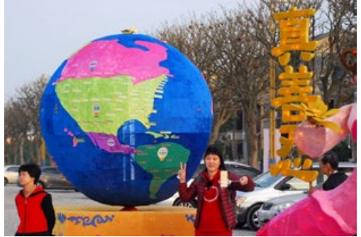
观众在法轮功学员的花灯区拍照留念。