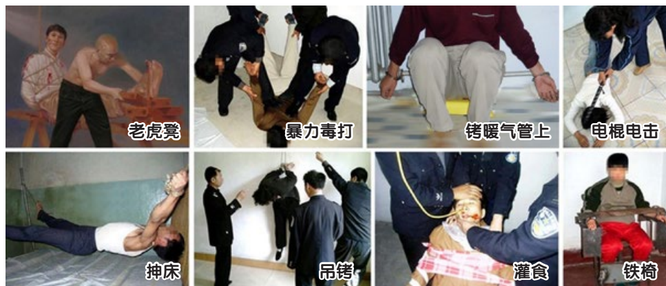
▲ 中共迫害法轮功学员酷刑示意图。

出狱后，房屋因无人居住，年久失修，破陋不堪。院落荒芜满目凄凉。半生相伴的兄长也因我的遭遇，悲愤忧伤而悄然离世。