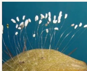
铜铁上的优昙婆罗花。佛像上的优昙婆罗花。土豆上的优昙婆罗花。