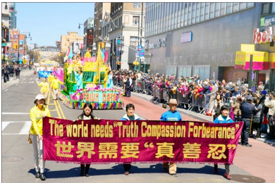
美国纽约大游行纪念“四·二五”和平上访 19 周年