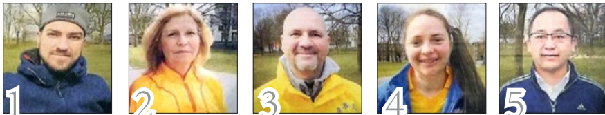
德国《鲁尔日报》报道法轮功并采访五位法轮功学员