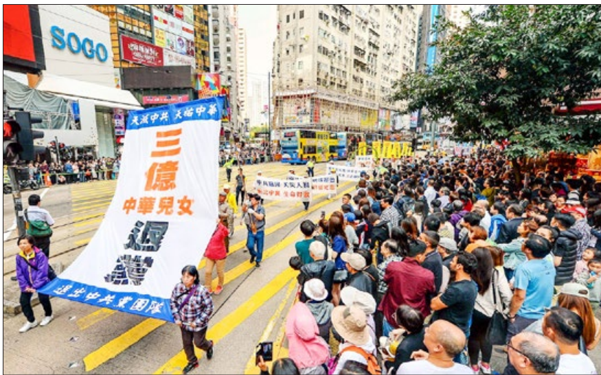
2018年3月18日，香港法轮功学员大游行，祝贺3亿中国人理智地选择未来。