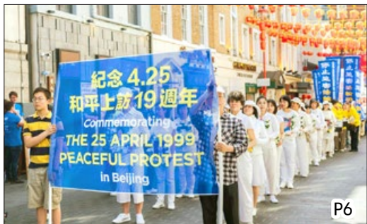
全球多地纪念“四·二五”和平上访 19 周年 (摄于伦敦唐人街, 2018 年 4 月 22 日)