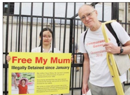
一位伦敦音乐人鼓励法轮功学员晓童

一位伦敦音乐人仔细聆听了法轮功学员被中共迫害的事实之后，写下了：正义必将战胜邪恶。◇