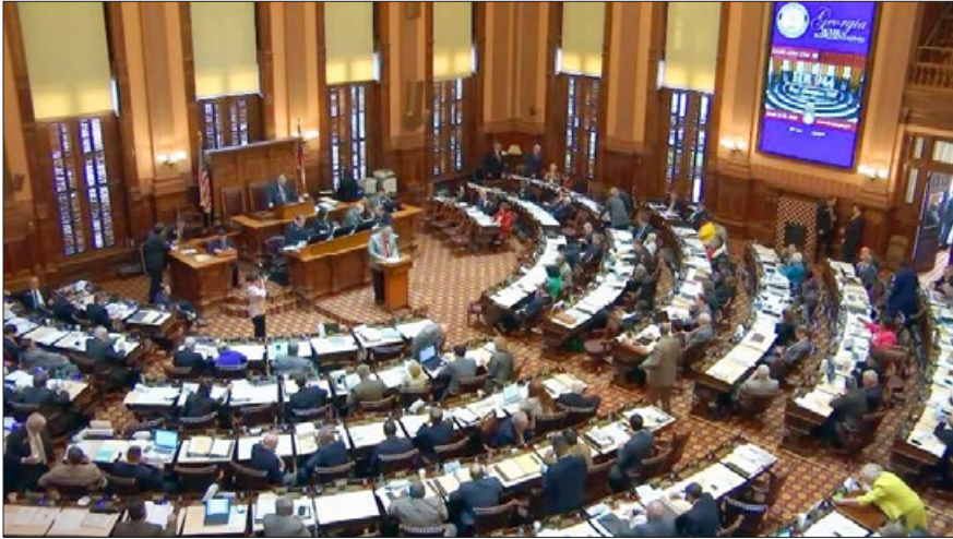
美国乔治亚州众议院一致通过 944 号决议案