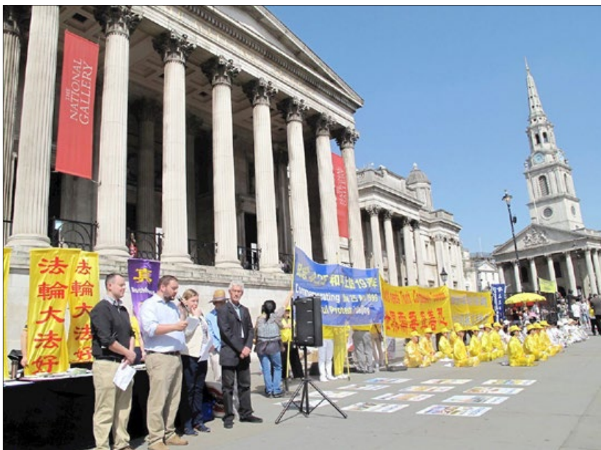
英国伦敦中使馆对面的新闻发布会，纪念“四·二五”和平上访 19 周年。此后，法轮功学员又举行大游行、传真相活动。