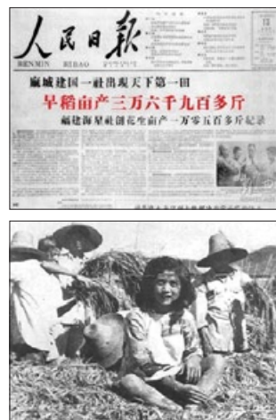
“压不倒的稻子”与“烧不坏的雪碧瓶”

◎ 前三十年是砸孔庙，破坏传统文化；后几十年是修孔庙，因为孔庙可以发展旅游经济来捞钱，糟蹋传统文化。