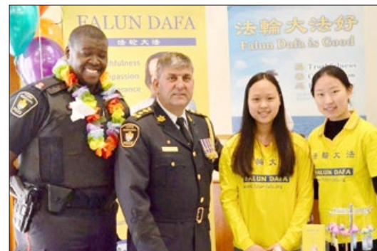
警察总长艾里克·乔里夫（左二）与法轮功学员

活动当天，约克区警察总长艾里克·乔里夫以及各级政府官员前来支持。警长来到法轮功的展位，与每个法轮功学员握手问候：“欢迎你们！谢谢你们！”警局督察瑞奇·维若潘先生说：“我们的职责是保护我们的社区、保护你们的权利、保护你们的信仰。法轮功在加拿大是受到保护的。”◇