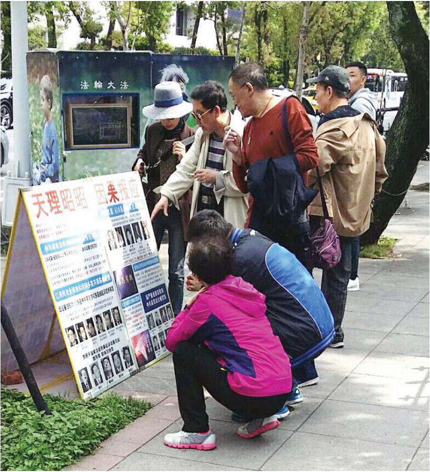
图:大陆游客在台湾国父纪念馆前认真看法轮功真相展板。

接着来了位女导游与学员打招呼，她说：“现在大陆游客对你们法轮功的反应很两极，你看我们这团都自己看自由拿的，那就是完全不怕的；另一种就是很怕很怕的，被共产党