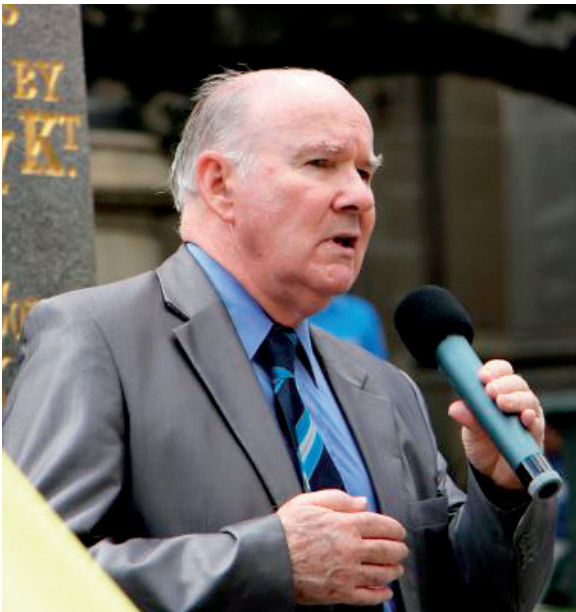
图：澳洲前公民委员会主席韦斯特摩（Peter Westmore）对三退勇士表示敬意。

（明慧墨尔本记者站报道）2018年3月25日星期天，澳洲墨尔本退党服务中心在市中心州立图书馆（State Library）前举办集会，声援三亿中国勇士退出中共党、团、队组织（简称“三退”）。