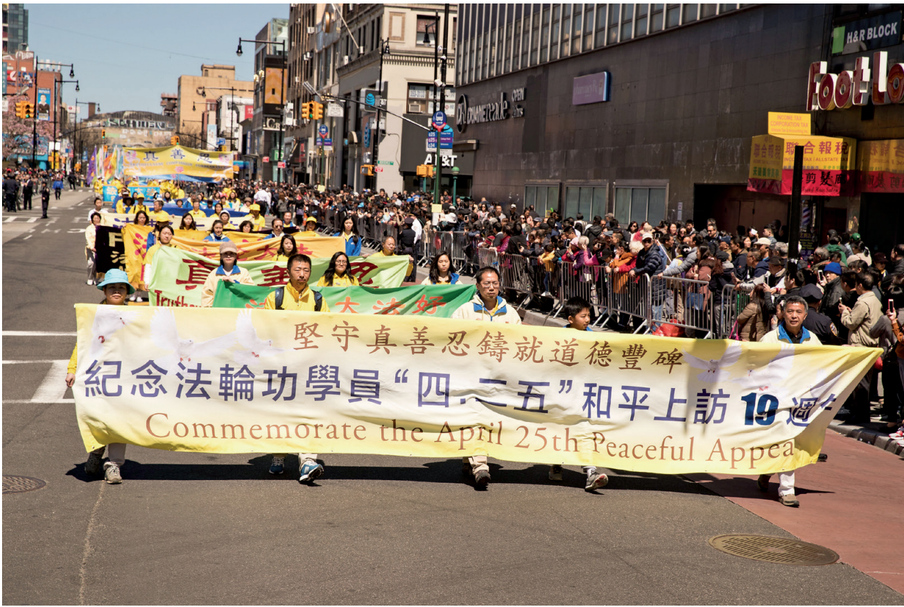
图:纪念“四·二五”和平上访十九周年暨声援全球三亿中国人退出中共党、团、队，大纽约地区部分中西方法轮功学员举办盛大游行。

当日的大游行场面壮观，震撼人心，观看游行的各族裔民众站满了马路两旁。他们不仅用手机拍下游行场面，还纷纷表达对法轮功的支持，并索要《大纪元特刊》和法轮功真相资料，并有民众在人行道上高呼：“法轮大法好！法轮功加油！”