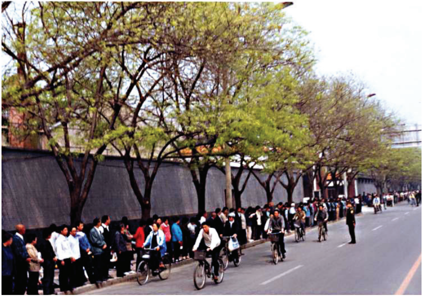
图：4.25上访现场图片。法轮功学员只是静静地排队依法上访，交通像往常一样畅通无阻。

但是，中共江泽民集团为了迫害法轮功，把依法上访说成是“闹事”、“围攻中南海”，这完全是栽赃陷害。实际上，法轮功学员非常平和理性，没有口号，没有喧哗，更没有阻塞交通。对中南海，他们既没有“围”，更没有“攻”，他们只是依法到国务院信访办上访，