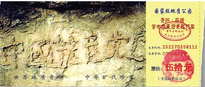
图：贵州省将平塘县藏字石景观建成国家级地质公园，图为公园门票，其中大石头上天然形成“中国共产党亡”六个大字历历可观。

细想想，发誓随时准备为中共牺牲一切？！多么恶毒的誓言？当然多数人并不愿真的为之“牺牲一切”。反过来讲，中国人自古重信义，言而有信是一个正常人的道德底线，一个连发誓都不当回事的人，当