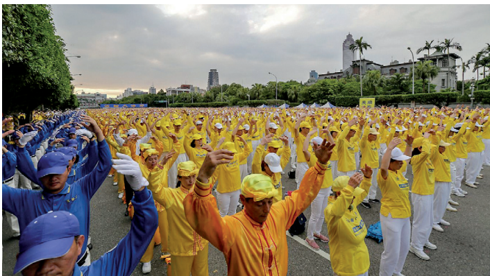
图:2018年4月22日，五千多名法轮功学员在台湾台北凯达格兰大道举办“纪念四·二五中国法轮功学员和平上访十九周年”活动，图为法轮功学员集体练功。