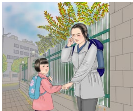
妈妈带姐姐离开了家