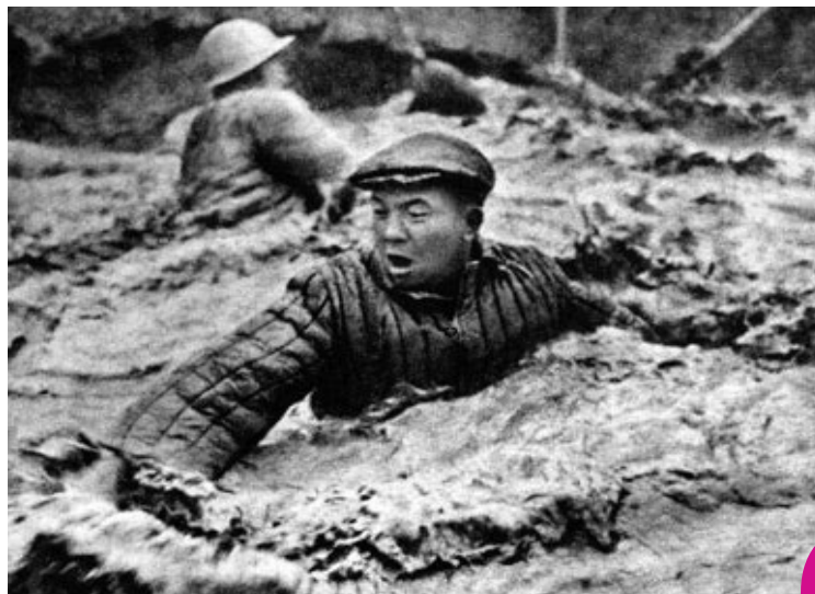
电影《创业》剧照中的王进喜

康世恩对人工搅拌泥浆很感兴趣，说：不错，应该树个典型。但是他并不想把奋不顾身跳进泥浆池的技术人员树为典型。因为当时中共歧视知识分子为“臭老九”。而是转身对同来汇报工作的大庆油田负责人说：找个人选，树个典型。