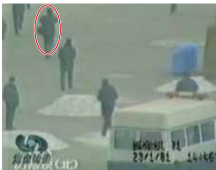
■ 图中的男子，在军警间从容拍摄。

我曾碰到过一位专业摄影师，当我对他说起“天安门自焚”是假的时候，他丝毫没有感到意外，很淡然的样子，认为这是一个不需探讨的话题：若非事先准备好了的多部摄像机多角度同时拍摄，而只是现场人员面对突发事件的临时抢拍，画