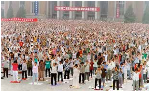
■ 1998 年 5 月，辽宁工业展览馆前万人集体炼功。

是伟大的李洪志师父给了我第二次生命。周围的人们，都知道我的癌症是炼法轮功炼好的，见证了法轮大法的神奇，许多人也走入了法轮大法修炼。◇