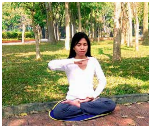
■ 阿方在炼法轮功第五套功法。如今她重获健康，又见光明。

于是，阿方从网上下载了《转法轮》，把字体放大到32号。阿方自己读书，也和同事交流书中的内涵。阿方说：“‘真、善、忍’照亮了我的生活，就像阳光