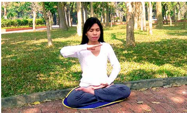
■ 阿方在炼法轮功第五套功法。如今她重获健康，又见光明。

于是，阿方从网上下载了《转法轮》，把字体放大到32号。阿方自己读书，也和同事交流书中的内涵。阿方说：“‘真、善、忍’照亮了我的生活，就像阳光照耀大地。几年来，我