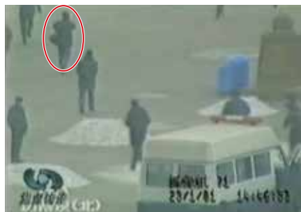
■ 圈中的男子，在军警间从容拍摄。

我曾碰到过一位专业摄影师，当我对他说起“天安门自焚”是假的时候，他丝毫没有感到意外，很淡然的样子，认为这是一个不需探讨的话题：若非事先准备好了的多部摄像机多角度同时拍摄，而只是现场人员面对突发事件的临时抢拍，画面怎可能那