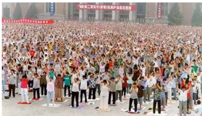
■ 1998年5月，辽宁工业展览馆前万人集体炼功。

是伟大的李洪志师父给了我第二次生命。周围的人们，都知道我的癌症是炼法轮功炼好的，见证了法轮大法的神奇，许多人也走入了法轮大法修炼。◇