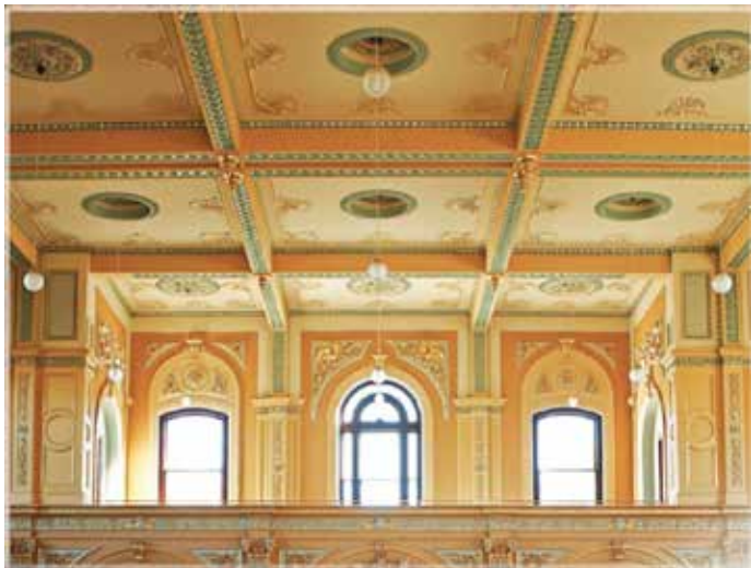
■ 芭芭拉参与的班迪戈市议会大楼修复工程广受好评

身体恢复以后，芭芭拉又开始投入到自己的工作中。她的作品和修复工作得到了更多人赞赏。在工作量巨大的班迪戈市议会大楼内部壁画和装饰的修复工程中，天花板破损严重，为了让画面与色彩