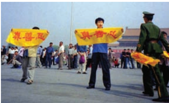
Polisi menghalangi upaya praktisi untuk bersuara menentang propaganda PKT, di Lapangan Tiananmen

Namun ketika penganiayaan dimulai, media pemerintah mengklaim bahwa Falun Gong telah “menyebabkan 1.400 lebih kematian”. Serangan media yang menampilkan gambar mengerikan dan cerita emosional disebarkan secara besar-besaran. Tidak ada bukti yang mendukung klaim ini dan PKT memblokir upaya independen untuk menyelidikinya. Pada akhirnya, ternyata cerita tersebut terutama berdasarkan pada kebohongan dan rekayasa.