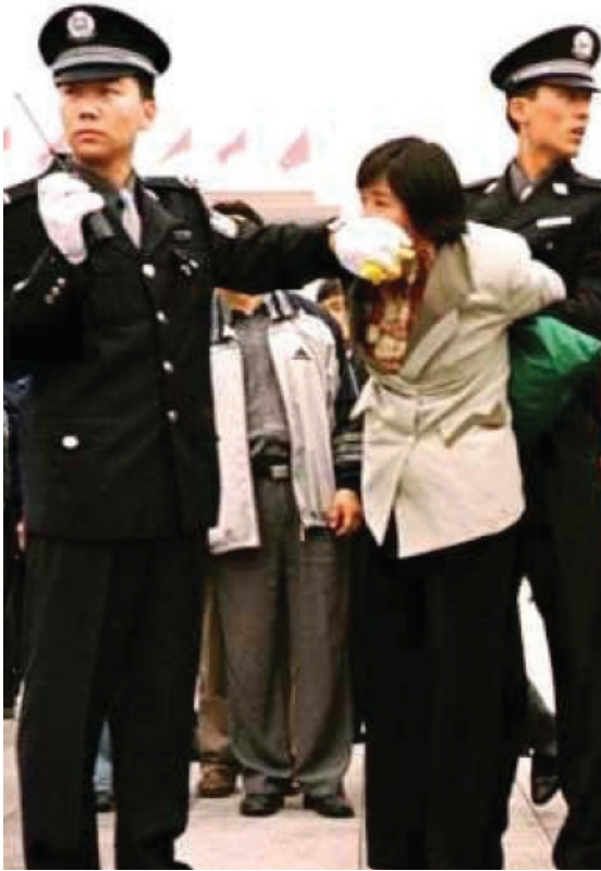
Di Tiongkok, tampil bersuara bagi Falun Gong telah menyebabkan tak terhitung praktisi Falun Gong dijebloskan ke penjara.

Namun ketika penganiayaan dimulai, media pemerintah mengklaim bahwa Falun Gong telah “menyebabkan 1.400 lebih kematian”. Serangan media yang menampilkan gambar mengerikan dan cerita emosional disebarkan secara besar-besaran. Tidak ada bukti yang mendukung klaim ini dan PKT memblokir upaya independen untuk menyelidikinya. Pada akhirnya, ternyata cerita tersebut terutama berdasarkan pada kebohongan dan rekayasa.