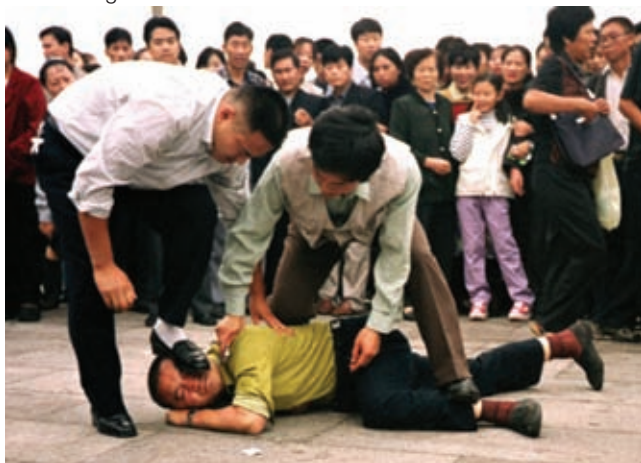
Atas: Polisi menangkap praktisi Falun Gong karena telah berbicara secara terbuka tentang penganiayaan.

Lebih dari 4.200 praktisi dipastikan meninggal akibat penganiayaan, ditambah ada berkali-kali lipat jumlah tersebut diyakini telah terbunuh dalam perampasan organ yang amat keji. Puluhan ribu orang telah ditangkap, ditahan dan disiksa. Keluarga yang tak terhitung jumlahnya telah tercabik-cabik karena pejabat partai memaksa anggota keluarga korban untuk berbalik melawan orang yang mereka cintai, yang berlatih Falun Gong.