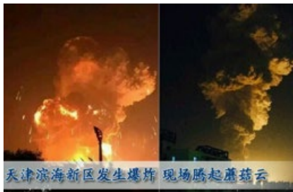
天津滨海新区发生爆炸 现场腾起蘑菇云

当人面临灾难而不自知时，一些奇怪的情况发生了，让一些人阴差阳错地躲过了灾难。下面这则故事就发生在中国大陆，当事人幸运地躲过了2015年的天津大爆炸。