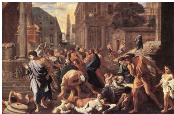
画家描绘的瘟疫（1630 年，法国画家 Nicolas Poussin）

古罗马帝国，强大无比，在小小病毒的折腾下落幕；迫害基督徒的古罗马帝王们，皆以厄运终结。历史如一面镜子，映照着一个不争的事实：迫害正信，必遭天惩。历史也正在重演，中共迫害正信，也必遭天惩，如何能在天谴中免于被中共捆绑连累，每个中国人当深深思之！