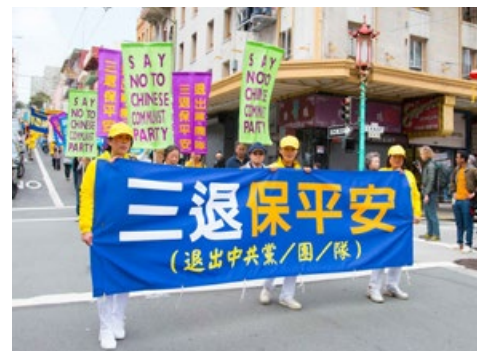
美国北加州退党服务中心在旧金山游行，声援三亿人三退。

“三退”是指退出中共的党、团、队组织。当初中国人加入中共党团组织时，都发过“为其奉献终身”的誓言，那就等于要与中共同命运。如果说，中共没做什么坏事，这个誓言也就无所谓，但是，由于中共自建政以来，与天斗、与地斗、与人斗，没干过什么好事，镇反、三反、五反、文化大革命、六四大屠杀，杀害了八千多万中国同胞，如今又迫害法轮功。