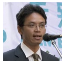
陈用林，原中共驻悉尼领馆负责监控法轮功的外交官。