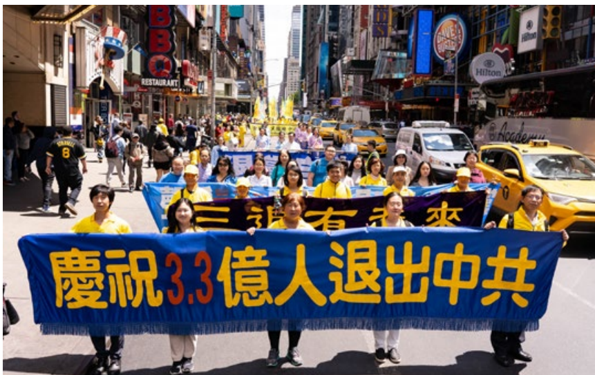
2019年5月16日，万名法轮功学员美国纽约大游行。

有人可能说“自己心中退党就算退了，不必声明”；还有人认为“自己多年没交党费了，就算自动退党了”；或者认为“年龄大了，已经自动退团、退队了”。但这都无法解除加入中共时发下的毒誓。而天灭中共时，没有解除这个毒誓的人，将成为中共的陪葬。只有采取公开的方式退出，有行为的表示，才能解除那个“毒誓”。神看人心，只要真心声明“三退”，用真名、化名、小名皆可。