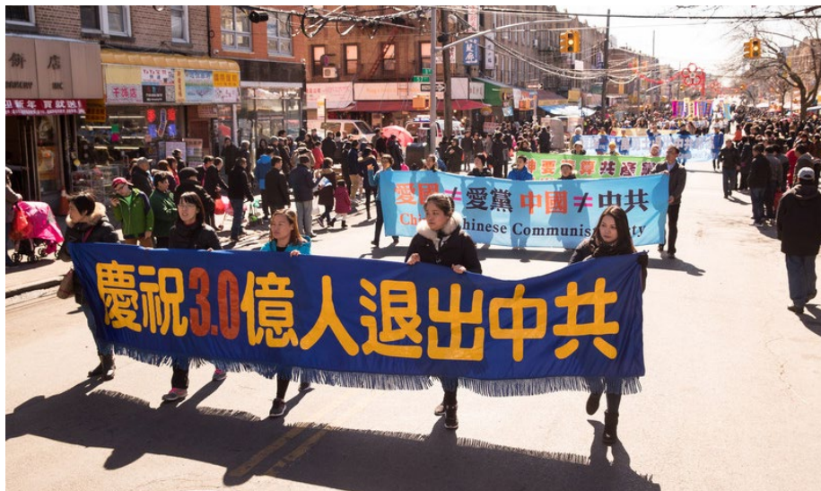
2018年3月11日，美国纽约法轮功学员布鲁仑大游行。

有人可能说“自己心中退党就算退了，不必声明”；还有人认为“自己多年没交党费了，就算自动退党了”；或者认为“年龄大了，已经自动退团、退队了”。但这都无法解除加入中共时发下的毒誓。而天灭中共时，没有解除这个毒誓的人，就将成为中共的陪葬。只有采取公开的方式退出，有行为的表示，才能解除那个“毒誓”。神看人心，只要真心声明“三退”，用真名、化名、小名皆可。