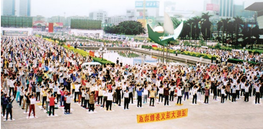
1998 年，广州的一个法轮功炼功点的学员们在晨炼。

法轮功自 1992 年 5 月 13 日由李洪志先生从中国长春传出，以简单明白的法理和祛病健身的奇效吸引了无数有识之士，至今已弘传世界 100 多个国家。李洪志先生和法轮大法因对人类身心健康做出的杰出贡献，获各国政府褒奖、支持议案、支持信函 3500 多项（上图）。