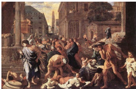
画家描绘的瘟疫（1630 年，法国画家 Nicolas Poussin）

古罗马帝国，强大无比，在小小病毒的折腾下落幕；迫害基督徒的古罗马帝王们，皆以厄运终结。历史如一面镜子，映照着一个不争的事实：迫害正信，必遭天惩。历史也正在重演，中共迫害正信，也必遭天惩，如何能在天谴中免于被中共捆绑连累，每个中国人当深深思之！