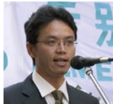
陈用林，原中共驻悉尼领馆负责监控法轮功的外交官。