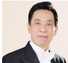
关贵敏，著名男高音歌唱家，中国“歌王”。