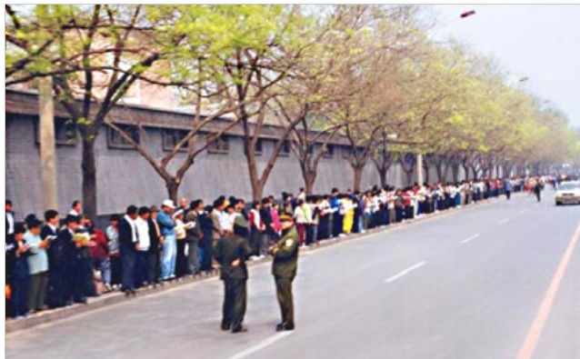
1999 年 4 月 25 日上访现场秩序井然，警察不用维持秩序。

有人认为法轮功学员上访导致中共迫害，其实不然。江泽民在 1996 年就预谋迫害法轮功，不断制造事端，直到 1999 年 4 月的天津抓人事件。万人和平上访，是法轮功学员在中共迫害升级的情况下，不得已采取的合法的反迫害举动，他们维护的是按“真善忍”做好人的权利，无关政治。