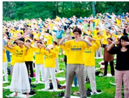
法轮大法“真善忍”的原则与祛病健身的超常功效吸引了越来越多的海外人士