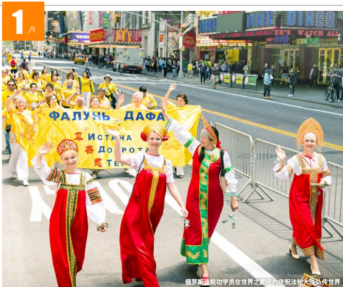
俄罗斯法轮功学员在世界之都纽约庆祝法轮大法弘传世界

二 1 元旦 三 2 廿七 四 3 廿八 五 4 廿九 六 5 小寒 日 6 腊八 一 7 初二 二 8 初三 三 9 三九 四 10 初五 五 11 初六 六 12 初七 日 13 腊八节 一 14 初九 二 15 初十 三 16 十一