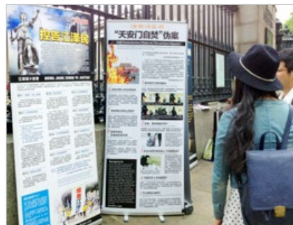
伦敦大英博物馆门前，华人了解中共江泽民集团导演的“天安门自焚”真相。