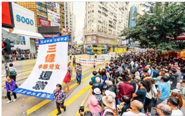
香港法轮功学员于 2018 年 3 月 18 日举行大游行，祝贺 3 亿中国人理智地为自己选择了光明的未来。

◎ 历代的败象，都没有腐败到像中共政权这样猖狂；历代的灭亡，都要带走它的追随者殉葬。贵州省平塘县掌布乡发现了一块距今 2.7 亿年的“藏字石”，500 年前崩裂的巨石断面上露出天然形成的六个大字“中國共產党亡”，昭示着天灭中共的天意。