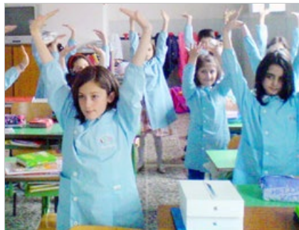
意大利小学生在课堂上炼法轮功，教师也以“真善忍”培养孩子的好品质。