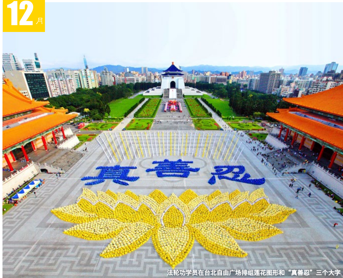
法轮功学员在台北自由广场排组莲花图形和“真善忍”三个大字

二 17 廿二 三 18 廿三 四 19 廿四 五 20 廿五 六 21 廿六 日 22 冬至 一 23 廿八 二 24 廿九 三 25 圣诞节 四 26 小寒 五 27 初二 六 28 初三 日 29 初四 一 30 初五 二 31 二九 三 1 元旦