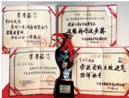
1993 年北京东方健康博览会，法轮功创始人李洪志先生获大会最高奖。