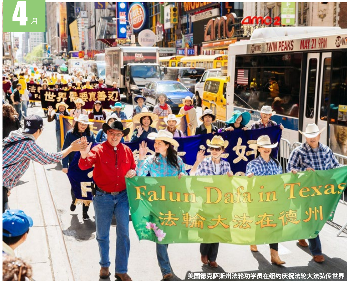
美国德克萨斯州法轮功学员在纽约庆祝法轮大法弘传世界

三 17 十三 四 18 十四 五 19 十五 六 20 谷雨 日 21 十七 一 22 十八 二 23 十九 三 24 二十 四 25 廿一 五 26 廿二 六 27 廿三 日 28 廿四 一 29 廿五 二 30 廿六 三 1 廿七 四 2 廿八