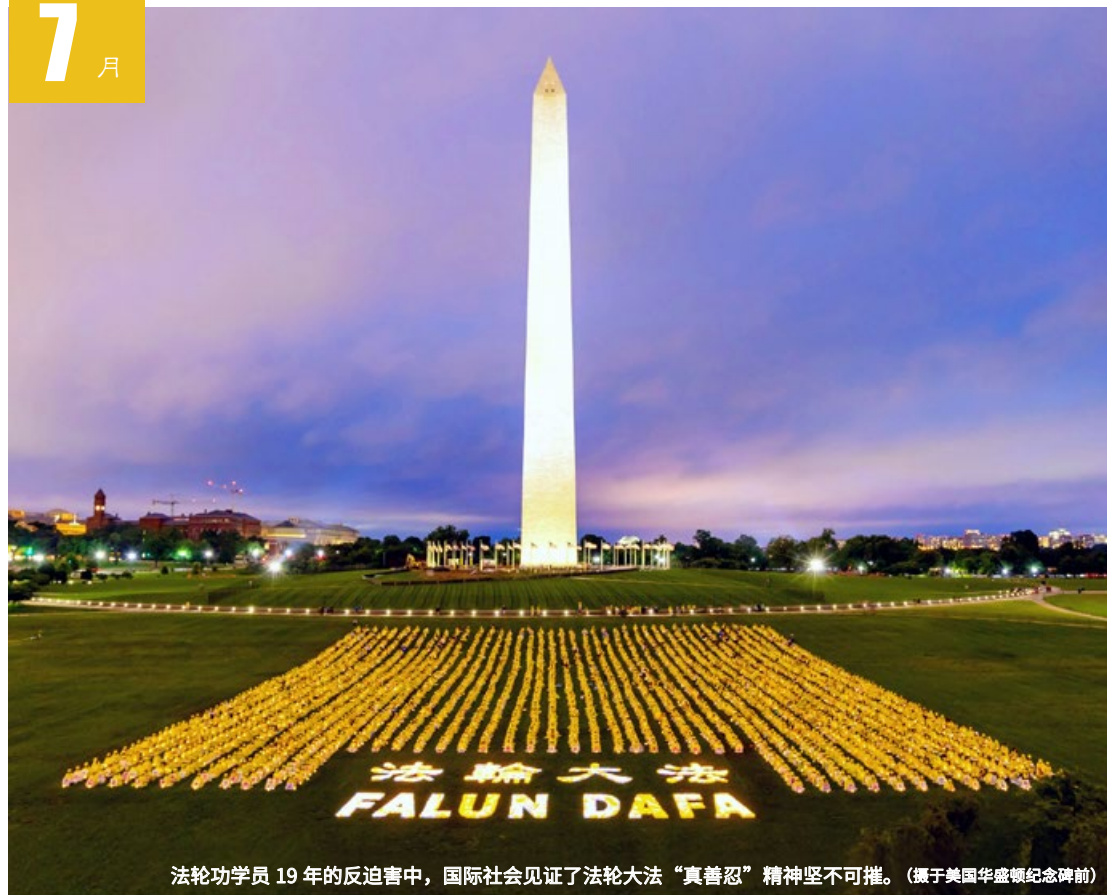
法轮功学员 19 年的反迫害中，国际社会见证了法轮大法“真善忍”精神坚不可摧。（摄于美国华盛顿纪念碑前）

三 17 十五 四 18 十六 五 19 十七 六 20 十八 日 21 十九 一 22 中伏 二 23 大暑 三 24 廿二 四 25 廿三 五 26 廿四 六 27 廿五 日 28 廿六 一 29 廿七 二 30 廿八 三 31 廿九 四 1 七月小