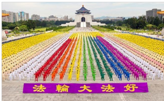
7000 多名法轮功学员在台湾台北市自由广场集体炼功