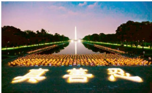
法轮功学员 19 年的反迫害中，国际社会见证了“真善忍”精神坚不可摧。