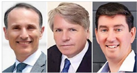
图左：瑞典企业家瓦西柳斯