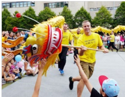
西方法轮功学员与海外华人同庆中秋 (摄于纽约罗斯福公园)