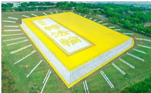
6000多名法轮功学员在台湾台中市外埔乡排组《转法轮》一书的立体画面