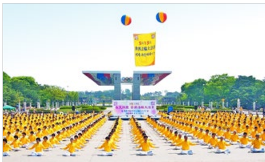
韩国法轮功学员在首尔奥林匹克公园炼功，场面壮观而祥和。