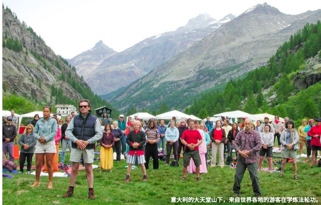
意大利的大天堂山下，来自世界各地的游客在学炼法轮功。

日 17 廿一 一 18 廿二 二 19 廿三 三 20 廿四 四 21 廿五 五 22 小雪 六 23 廿七 日 24 廿八 一 25 廿九 二 26 十脉 三 27 初二 四 28 初三 五 29 初四 六 30 初五 日 1 初六 一 2 初七