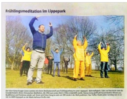
德国《鲁尔日报》于 2018 年 4 月 11 日整版报道法轮功令人心身健康的事实