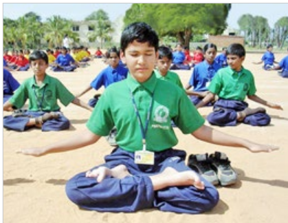
印度学生炼法轮功。《印度时报》报道：法轮大法让人修心向善，摒弃恶习。