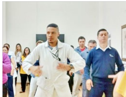
巴西圣保罗市大型医院 Presidente 医院的医护人员，认真学炼法轮功。