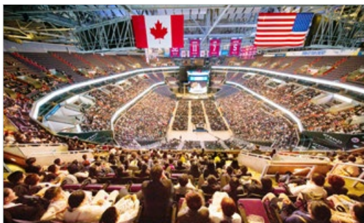
世界各地的近万名法轮功学员于 2018 年 6 月在美国首都举行修炼心得交流会