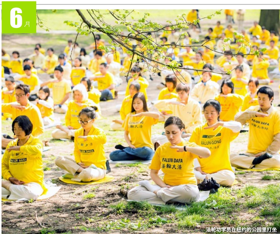
法轮功学员在纽约的公园里打坐

六 1 廿八 日 2 廿九 一 3 五月初八 二 4 初二 三 5 初三 四 6 芒种 五 7 端午节 六 8 初六 日 9 初七 一 10 初八 二 11 初九 三 12 初十 四 13 十一 五 14 十二 六 15 十三 日 16 十四