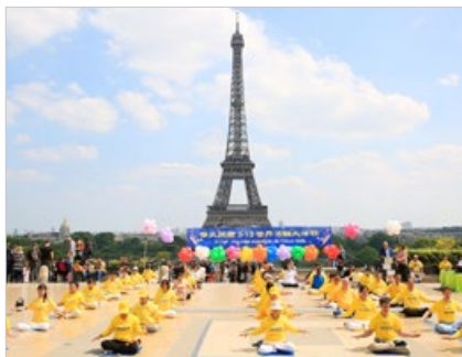
法国巴黎法轮功学员以炼功、文艺表演等形式，庆祝“世界法轮大法日”。