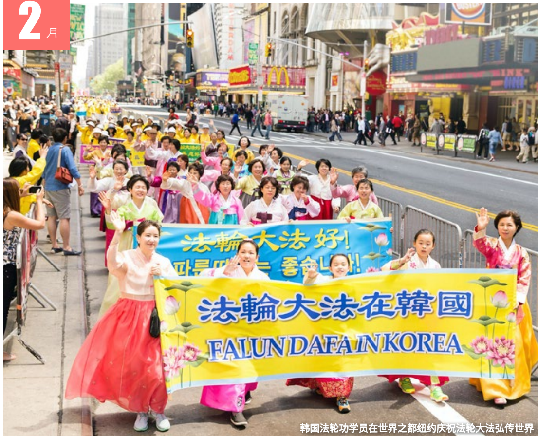
韩国法轮功学员在世界之都纽约庆祝法轮大法弘传世界

日 17 十三 一 18 十四 二 19 元宵节 三 20 十六 四 21 十七 五 22 十八 六 23 八九 日 24 二十 一 25 廿一 二 26 廿二 三 27 廿三 四 28 廿四 五 1 廿五 六 2 廿六 日 3 廿七 一 4 九