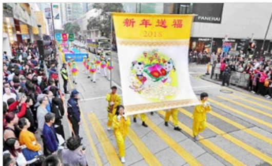
香港法轮功学员游行贺新年，路旁观众人山人海。（2018年1月）