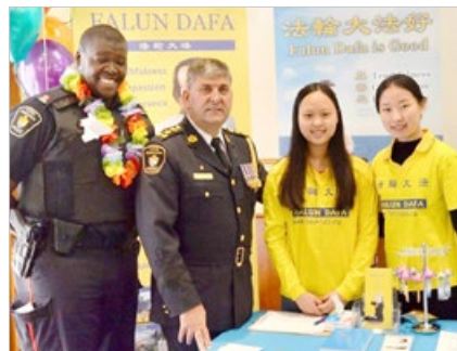
加拿大多伦多约克区警局警察总长感谢法轮功学员对社区的积极贡献