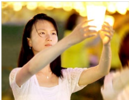
法轮功学员在反迫害中展现出和平、坚忍和慈悲，让世人看到希望。