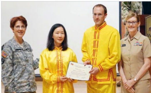
美国军队医学研究所向长期到社区教功的法轮功学员（中间两位）颁发褒奖