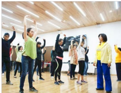
法轮功学员应邀到墨西哥联邦政府机构社会保障管理局教功