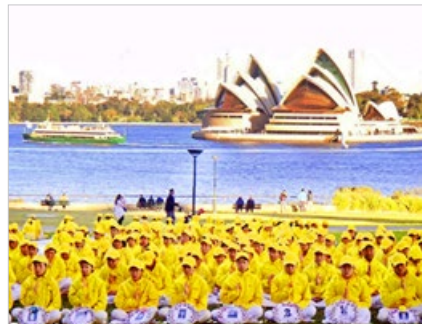
澳大利亚悉尼法轮功学员呼吁制止发生在中国大陆的迫害