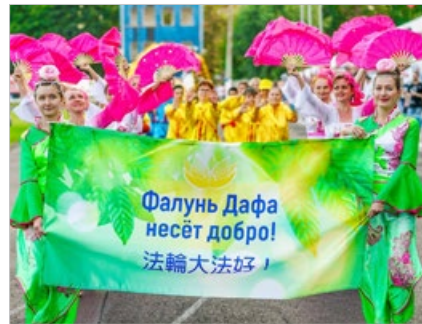
俄罗斯法轮功学员于 2018 年 9 月 1 日 受邀参加阿尔扎马斯市城市日庆典