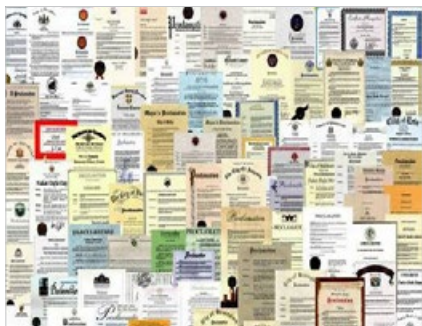
法轮大法福益世界，获得各国政府褒奖、支持议案和信函 3500 多份。