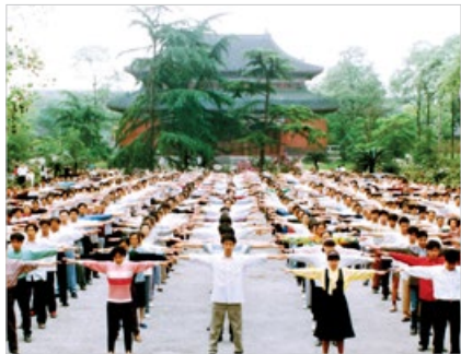
在 1999 年 7 月中共迫害法轮功前，四川成都法轮功学员集体炼功。