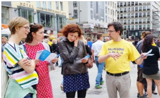
奥地利维也纳市民向法轮功学员（黄衣者）了解中共迫害法轮功的真相