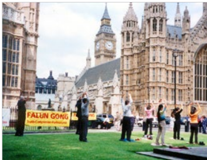
英国伦敦法轮功学员在炼功。欧洲的40多个国家都有法轮功修炼者。