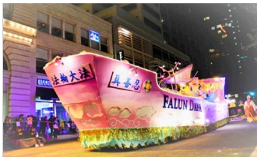
有“真善忍”字样的法轮功学员的花车，获美国波特兰玫瑰节星光游行最高奖。