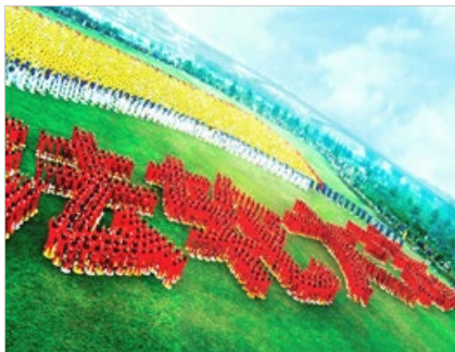
中国武汉法轮功学员在汉水公园排组“法轮大法”四个大字（1999年3月）