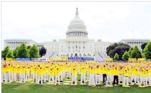
来自不同国家、不同族裔的法轮功学员在美国国会山前炼功。