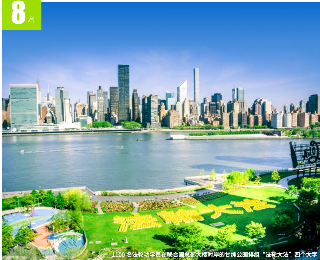
1100 名法轮功学员在联合国总部大楼对岸的甘纯公园排组“法轮大法”四个大字

六 17 十七 日 18 十八 一 19 十九 二 20 二十 三 21 廿一 四 22 廿二 五 23 处暑 六 24 廿四 日 25 廿五 一 26 廿六 二 27 廿七 三 28 廿八 四 29 廿九 五 30 八月 六 31 初二 日 1 初三