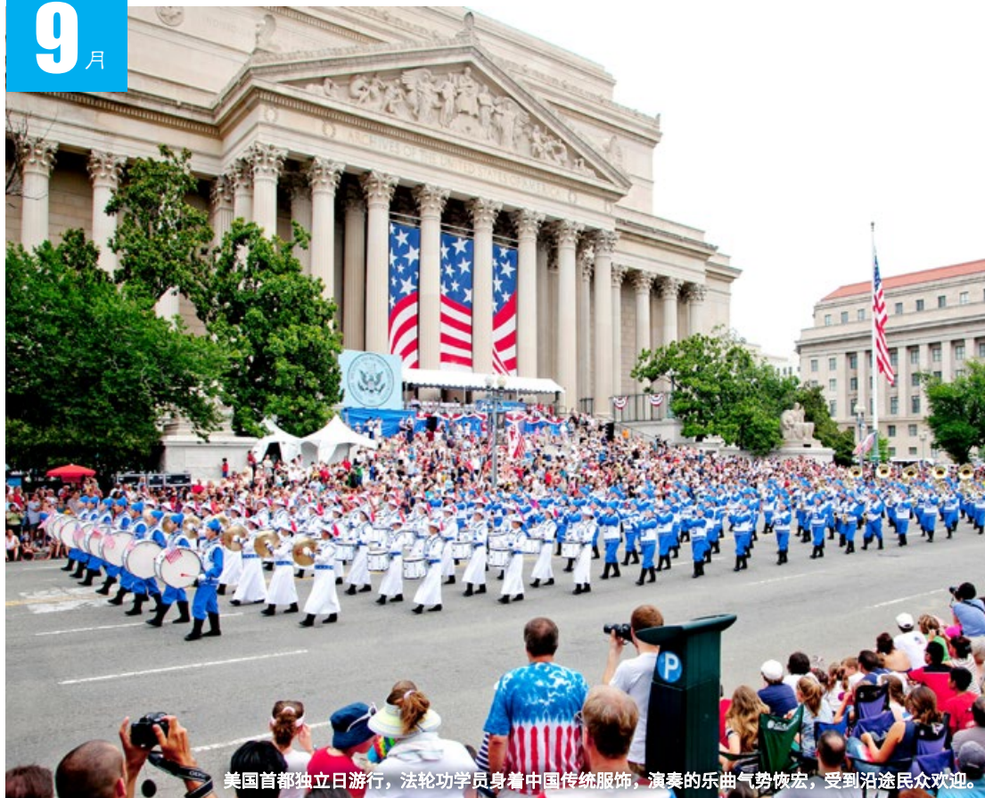
美国首都独立日游行，法轮功学员身着中国传统服饰，演奏的乐曲气势恢宏，受到沿途民众欢迎。

二 17 十九 三 18 二十 四 19 廿一 五 20 廿二 六 21 廿三 日 22 廿四 一 23 秋分 二 24 廿六 三 25 廿七 四 26 廿八 五 27 廿九 六 28 三十 日 29 九月小 一 30 初二 二 1 初三 三 2 初四