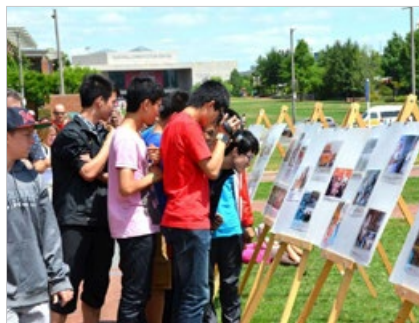
美国费城自由钟广场上，中国大陆游客阅读、拍摄法轮功真相展板。