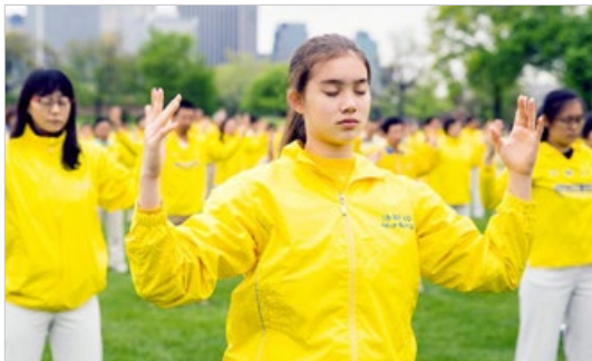
在海外法轮功学员集体炼功的场景中，经常可以看到青年学子的身影。