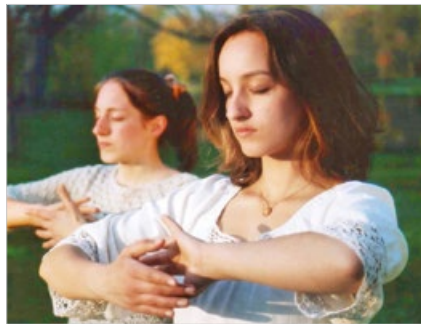
德国姐妹在炼法轮功。修炼法轮大法“真善忍”，使人善良，宽容，平和。