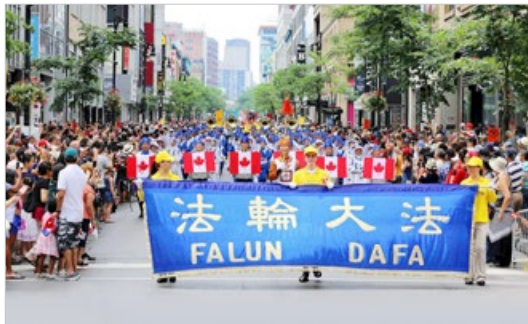
2018 年加拿大国庆日游行，蒙特利尔市民 欢迎法轮功学员的队伍。