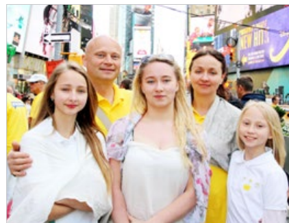
温纳与克里斯蒂娜夫妇及三个女儿都修炼法轮功，全家人找到真福。