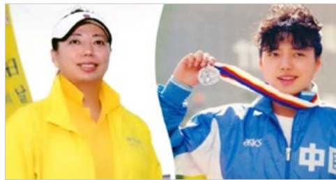
图右：奥运奖台上的黄晓敏