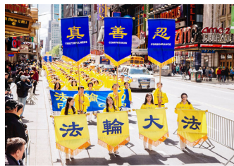
◎ 2017年5月，来自世界各地的法轮功学员在曼哈顿举行盛大游行，吸引众多游客驻足。