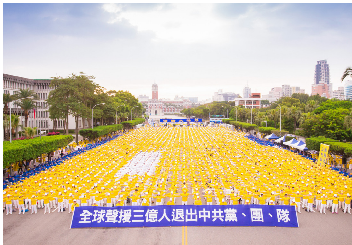
© 2018 年 4 月 22 日，台湾法轮大法学会举办盛大游行，声援中国大陆民众 3 亿人退出中共党、团、队。图为法轮功学员在集会现场演练法轮功法。