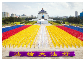
◎ 台湾 6000 多名法轮功学员齐聚自由广场集体炼功。台湾修炼法轮功人数达 50 万人。

从此以后，面对婆婆对自己的不断责骂，面对婆婆对年幼女儿的极端冷漠，秀贞以法轮功“真、善、忍”的标准要求自己，事事为患有严重抑郁症的婆婆考虑，细心照顾她，终于解开了婆媳之间错综复杂的矛盾、怨恨和纠结。婆媳俩从貌合神离的表面亲和，最终走到倾听心事，无所不谈，情同母女的融洽，让邻居亲戚都羡慕不已。秀贞说：“如果不修炼法轮功，我绝对做不到这样，说不定比婆婆的抑郁症还要重。”