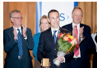
◎ 瑞典国王奖获奖者瓦西柳斯说：如果我不修炼法轮功，绝对不能胜任今天的工作。