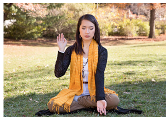
◎ 依力修炼法轮功至今已 20 年了，读《转法轮》和炼功是她生活不可或缺的一部分。