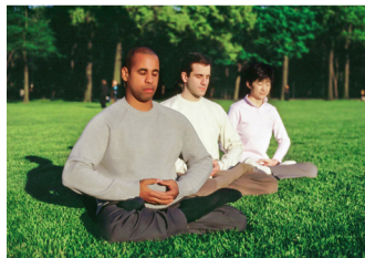
◎ 科学研究证明：炼功能打通、加宽经络，将能量向高层次转化。这是现代医学做不到的。

2016 年 6 月，美国临床肿瘤学会（ASCO）官网发表一篇论文，公布一项研究成果：修炼法轮功可以使癌症症状缓解或痊愈。