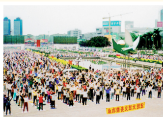
© 1998 年，广州一个炼功点的法轮功学员在炼功。1999 年广州有近 25 万人修炼法轮功。