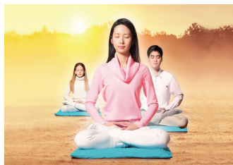
◎ 玛格丽特博士经多年临床试验，出版《法轮功的正念实践》，探究法轮功健身奇效。