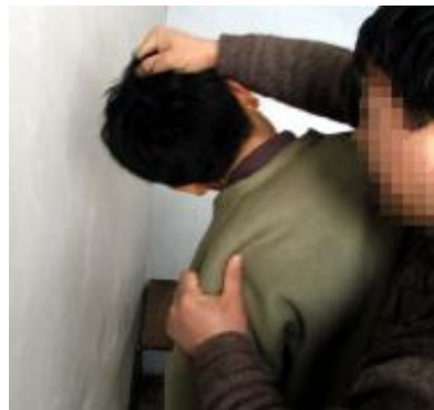
↑ 中共酷刑演示：揪头发撞墙 ↘ 中共酷刑演示：面壁、罚坐