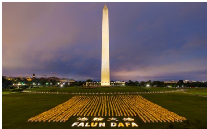
2018年6月22日晚，近三千名法轮功学员在美国首都华盛顿纪念碑下举行烛光夜悼。

1999年7月20日以来，中共媒体一直宣称炼法轮功死了1400人，后来又升级为1700人。且不说这些说法不敢接受任何第三方的独立调查，就算是真有这1700例，就算是炼法轮功的人数真的只有1999年7月22日以来中共媒体宣称的200多万，那么法轮功修炼者的年平均死亡率也不到万分之三，远远低于中国人口万分之六十五的年平均死亡率。这种宣传恰恰反映了法轮功在祛病健身方面的奇异功效。