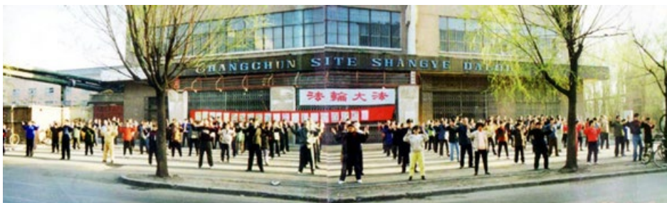
1998年4月19日长春法轮功学员晨炼的场景

联名致信江泽民和朱镕基，对公安部干扰法轮功学员正常炼功活动的做法提出批评，指出他们的做法违反了宪法和法律。对此，朱镕基总理曾明确批示，法轮功这些年给国家节省了大量的医药费，公安部不应该去找法轮功的麻烦，而应该抓好社会治安问题。