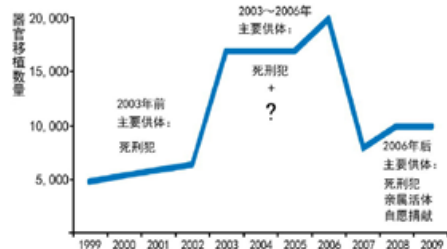
中国器官移植数量趋势图 (根据中共官方公布的部分数据)

国际社会经过严谨的调查取证，出版了：《血腥的活摘器官》、《国家掠夺器官》和《屠杀》三本书，详尽地证实了中共活摘法轮功学员器官贩卖的事实。