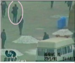
圈中的男子，在军警间从容拍摄。