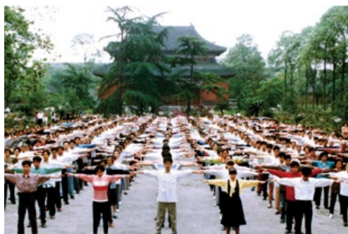
成都法轮功学员集体晨炼的场景

为制止公安部个别人继续搞小动作，1998年5月，国家体育总局对法轮功进行了全面调查了解，结果表明法轮功的祛病健身总有效率为97.9%。10月20日，国家体总又派调研组到炼功人数较多的长春和哈尔滨进行实地考察。考察结束后，调研组组长发表讲话说：“我们认为法轮功的功法功效都不错，对于社会的稳定，对于精神文明建设，效果是很显著的，这个要充分肯定的。”特别值得一提的是，1998年，北京135位修炼法轮功的社会知名人士