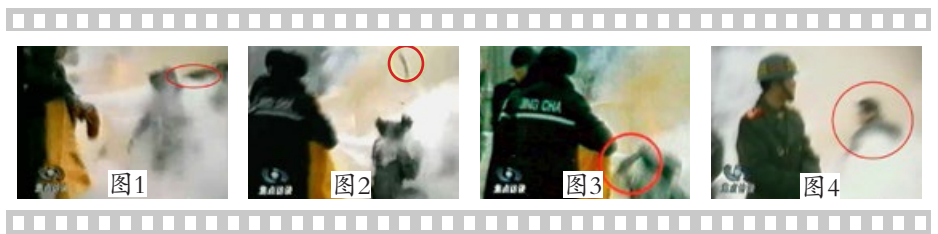
凶手猛击刘的头部 一条状物弹起 用手摸头，突然倒地 凶手刚刚用过力的姿势 CCTV “自焚”录像慢动作分析

2003 年 11 月 8 日，由北美中文电视台“新唐人”制作的揭露 2001 年“天安门自焚真相”的纪录片《伪火》（False Fire），从各国参赛的 600 多部影片中脱颖而出，获第 51 届哥伦布国际电影节荣誉奖。哥伦布国际电影节在纪录片领域享有盛誉，其历史仅次于“奥斯卡”。该片以触目惊心的画面和精辟严谨的分析，揭示了 2001 年初的“自焚”案的诸多疑点，从而证实了该案是江泽民集团为栽赃法轮功而炮制的一起伪案。