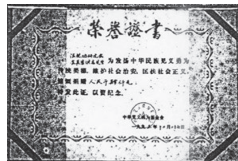
公安部的感谢信及荣誉证书原件