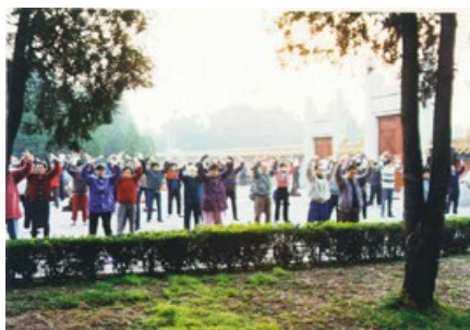
法轮功学员在北京地坛公园集体炼功。