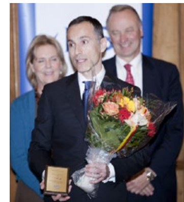
瓦西柳斯获奖现场

面对成绩，他说：“如果我不修炼法轮功，我绝对不能胜任今天的工作，正因为我是一个修炼人，平时按照‘真、善、忍’的标准来要求自己，才使得我的公司经营得这么成功，这一切都归功于师父和大法，绝对是这样的！”他还说：“修炼法轮功后，我感到了内心的宁静祥和，我明白了生命真正的意义。”