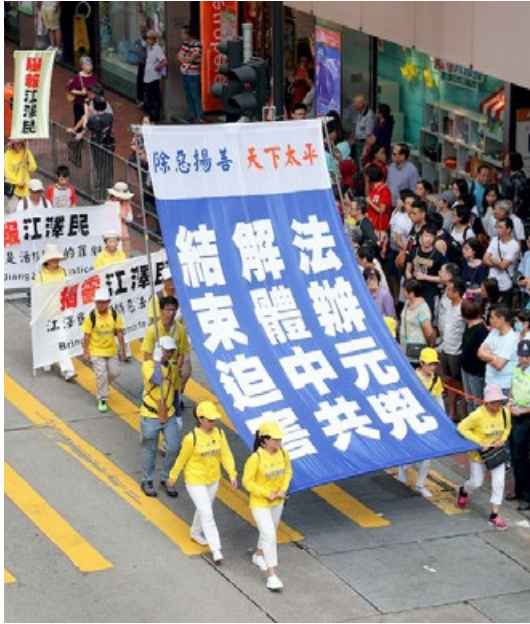
法轮功学员在香港举行纪念和平理性反迫害 19 周年的集会游行。

百姓中毫无威望可言，他的这种阴暗变态心理往往就会变本加厉，表现得更加突出。不幸的是，江泽民恰恰就是这样一个独裁者！