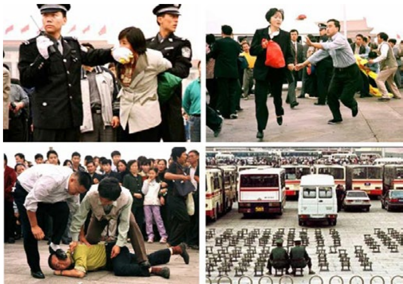
手无寸铁的法轮功学员在天安门广场被残暴对待

1999年7月20日中共发动迫害法轮功，利用所有媒体进行造谣诬陷，用一切手段封杀法轮功学员讲清事实真相的权利；销毁大量法轮功书籍，让百姓无法从中了解真相。在上告无门的情况下，法轮功学员只得采取上访的方式，用国家法律赋予公民的这一合法途径，向中共当权者反映法轮功的真实情况，期待能停止这场迫害。