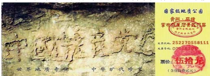
图：2002 年 6 月在贵州发现的“藏字石”断面上显现“中国共产党亡”六个大字，昭示着“天灭中共”的天意。

听他这么说，我就给他讲了善恶有报是天理，上天将要灭中共，“三退”才能保平安，而没有“三退”的将来可能会受到中共的牵连，他听得很认真，觉得我说的有道理，很快同意退出中共的党、团、队组织。